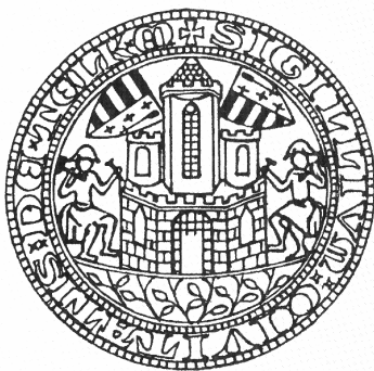
Telkibánya középkori várospecsétjének rajza. (14. sz.)

Zágráb 36, 47, 127 Zagyva folyó 127 Zala vármegye 12 Zalatna (Zalathna, Zlathnya- bania) 130, 145 Zarbouth 112 Zazurbánya (Szazár, Szazár- hegy) 117, 119 Zemplén vármegye 89, 91-93, 112, 150 Zennabánya 150 Zipser Neudorf l. Igló Zólyom 40, 120 Zólyom vármegye 39, 44, 47, 54, 56, 58, 61, 69, 82, 8 Zsakarócz (Soekelsdorf) 97