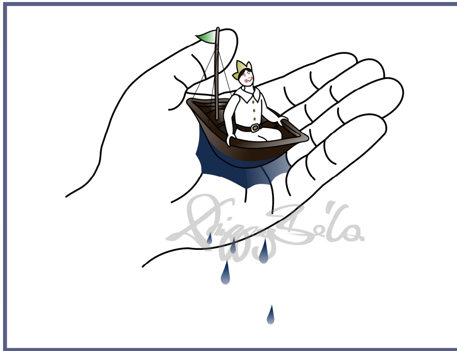
A kis herceg