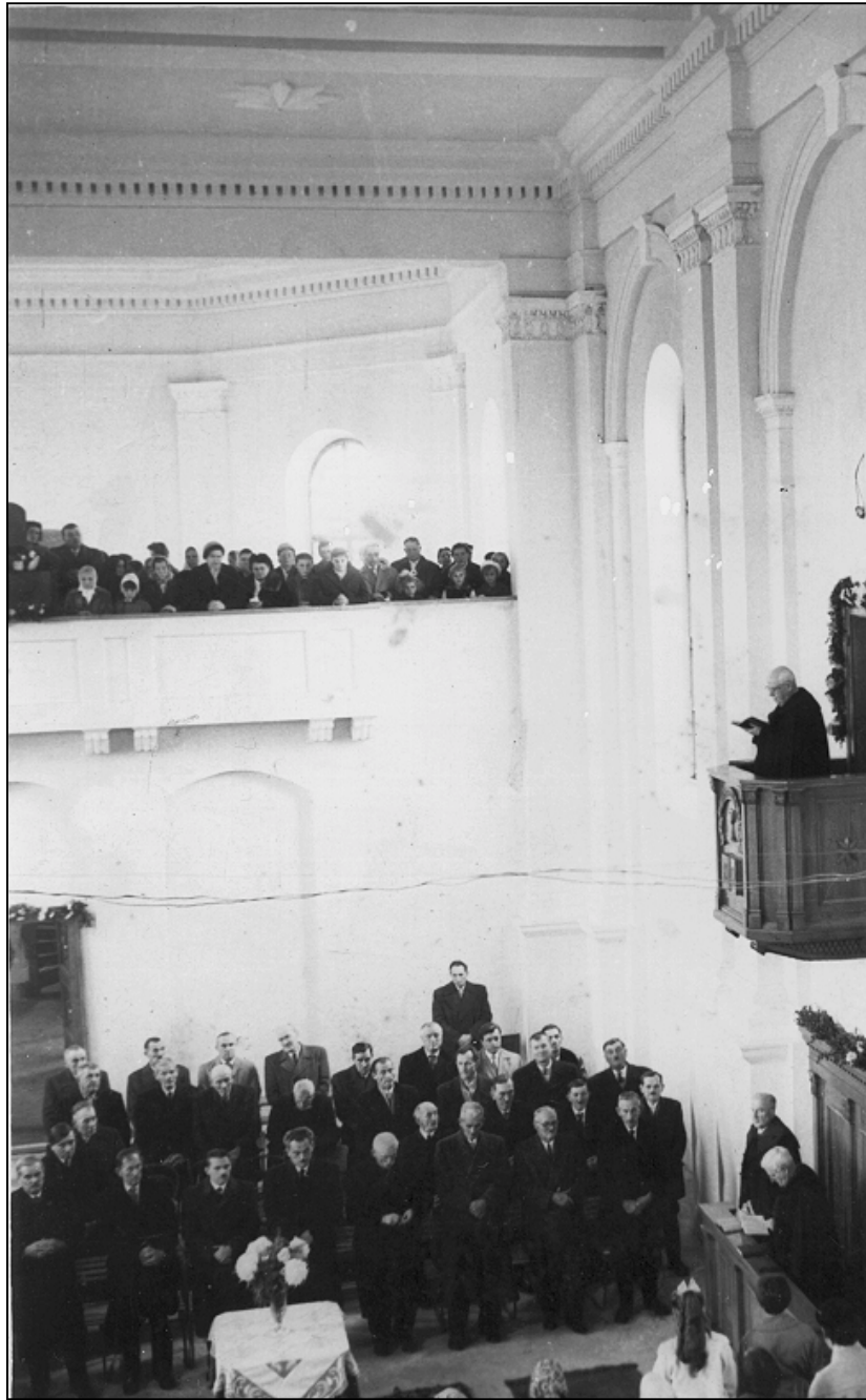
Győry Elemér püspök felszentelő beszédet mond a templom első részleges felszentelésekor (1961)