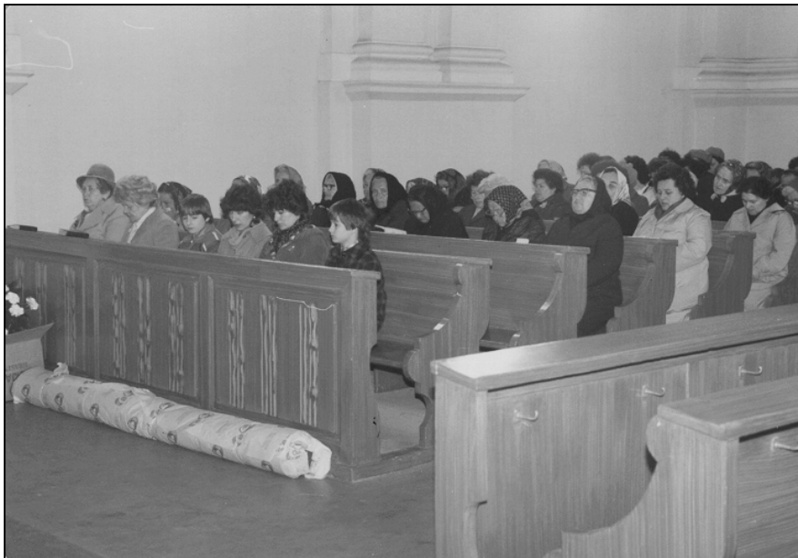
A gyülekezet a lelkészi búcsúztatón (1984)