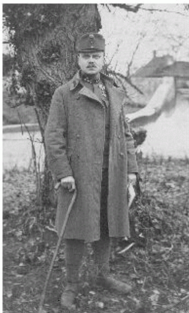
Bor Dezső mint katonakarmester 1918-ban a keleti fronton: