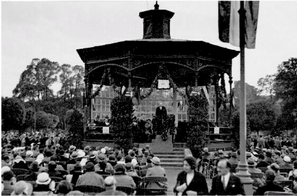
1000-ik hangverseny a városligeti lparcsarnok előtti zenepavilonban 1933. július 8.