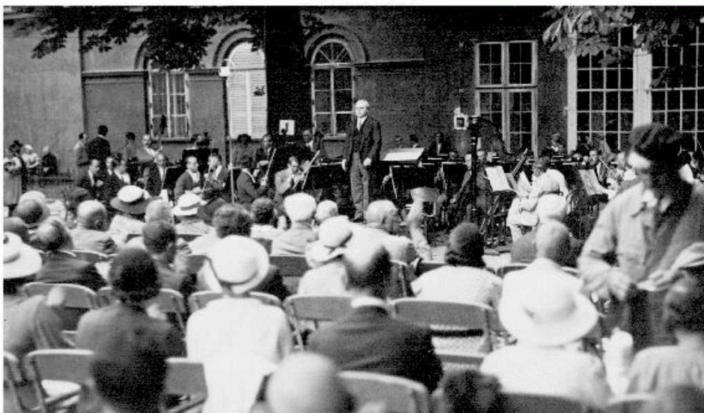
Első hangverseny a Károlyi kertben, 1934-ben A zenekar részére még nem készült el a pódium