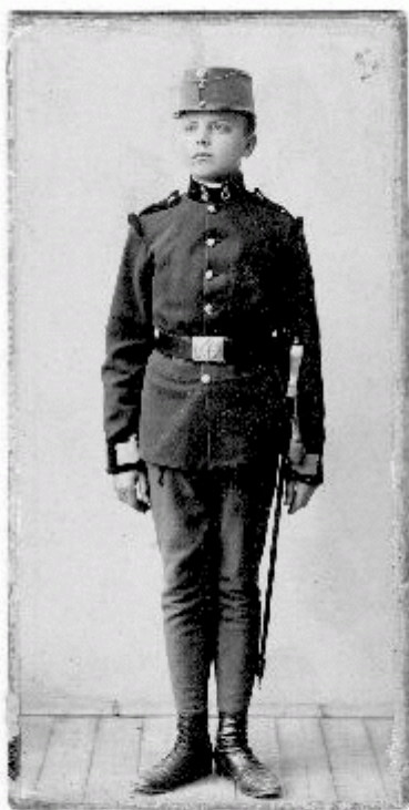
Bor Dezső mint fiatal katonazenész 1904-ben