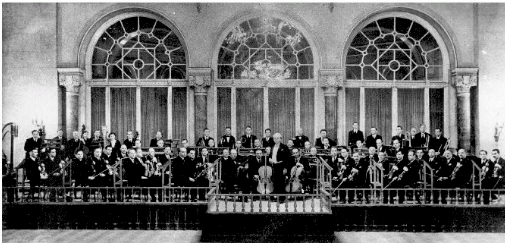
10 éves jubileumi hangverseny a Vigadóban 1933-ban