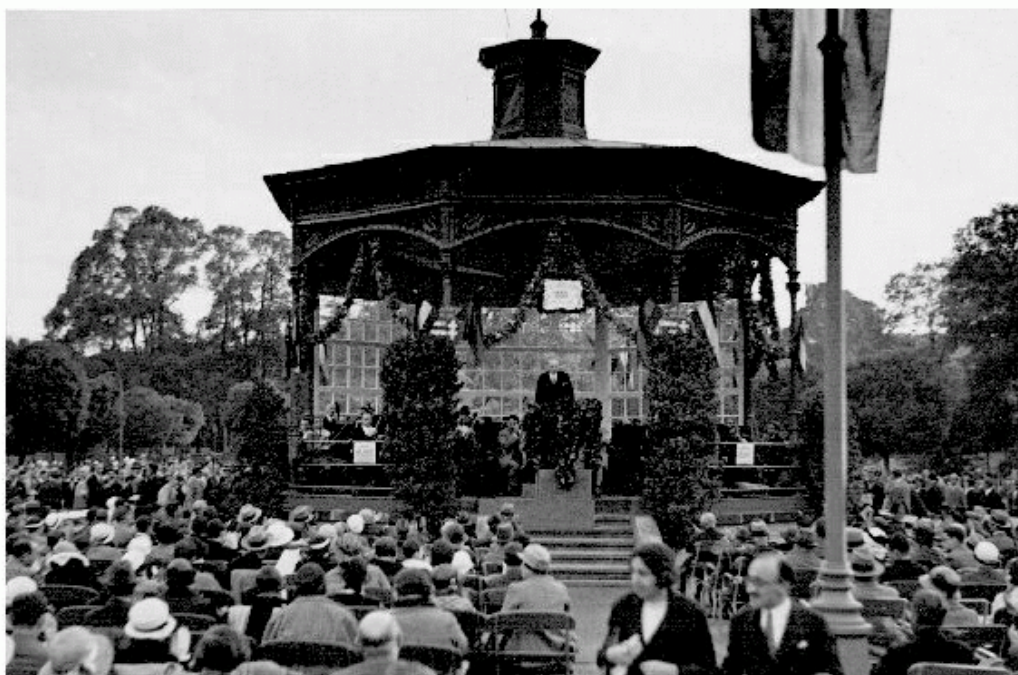
1000-ik hangverseny a városligeti lparcsarnok előtti zenepavilonban 1933. július 8.