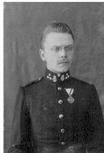
Bor Dezső mint fiatal katonazenész 1908-ban