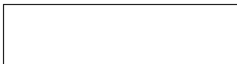
2 ábra. A szénkörforgás, mutatva a természetes és mesterséges szénmozgásokat a légkörbe és a légkörből. Évente nettó 7 Gt az emberi tevékenység által a légkörbe bocsátott szén, melyből kb. 4 Gt-t a természetes „lefolyók” (óceán és erdő) visszaforgatnak, így évente 3 Gt-t adunk hozzá. (Legett J, 1990 (12) és UNEP, 1991 diagramjait felhasználva.)

Kb. 40.000 gigatonna (Gt = egy milliárd tonna) szén kering a bioszférában (6.2 ábra). Ez a körforgó szénnek három forrásából származik, - mindegyike 600-1000 Gt, - melyek a légkört, a növényeket és az óceánok felszíni rétegeit „táplálják”. Az állati élet mindössze 1-2 Gt-t forгат. A következő, a lassú mozgású 1500 Gt mennyiségű szén a talajban van mint detritusz [szerves eredetű törmelék], és a még lassúbb 38000 Gt-nyi a mély óceánokban. Ráadásul a „természetesen körforgó” szénen kívül hatalmas szénkészlet van, melyet az üledékes mészkőrétegek vagy az e fejezetben nagyon fontos szerepet kapó ásványi tüzelőanyagok kötöttek meg a fiatal Föld légköréből. (Kb. 10000 Gt szén.) Így az ásványi tüzelőanyagok égetésével olyan szén és napenergiát szabadítunk fel, melyet az egyszerű növények kötöttek meg nagyon régen. Az égés átalakítja a szerves, energiatartalmú szénhidrogén molekulákat szén, hidrogén és (kisebb mennyiségben) nitrogén oxidokká - azaz széndioxidá, vízgőzzé és nitrogénoxidá.