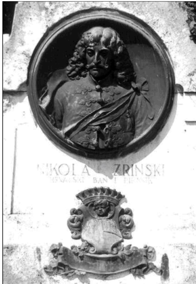
10. kép: A Zrínyi-emlékoszlop