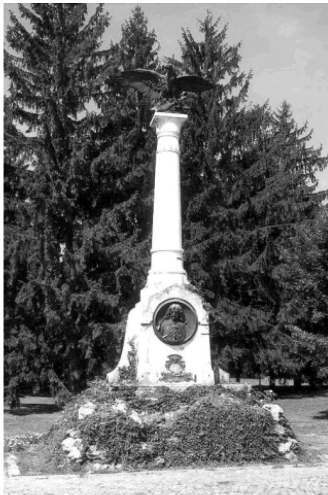
5. kép: A Zrinyi-emplékoszlop (Papp József felvétele, 2003)

Zrinyi Miklós költő egyetlen klasszikusa ennek a vidéknek, hiszen a történelem folyamán a múzsák úgymond évszázadokon keresztül elkerülték ezt a tájat és az itt élő magyar közösséget. A Zrinyi-kultusz ügye, amely Zrinyi Miklós és családja iránti nagyfokú, gyakran túlzott tiszteletet jelent, bennem már régebben megfogalmazódott. Már középiskolás koromban, irodalmi olvasmányaim készítésére bolyongtam a csáktornyai várban, és kerestem Zrinyi Miklós költő eltűnt korának a nyomait. A mai napig él bennem ez a készítés.