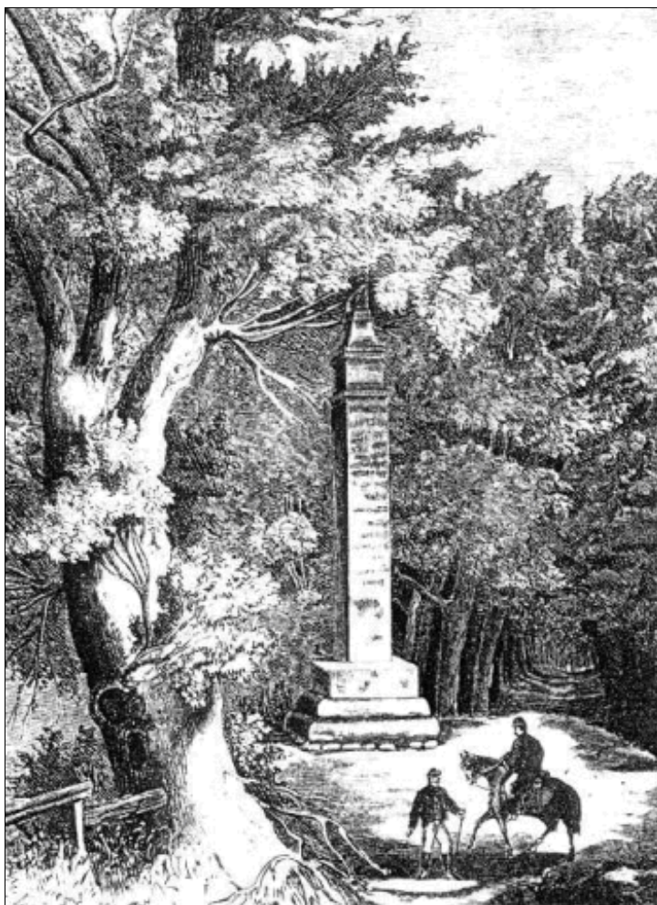
7. kép: A kursáneci emlékoszlop. Illusztráció