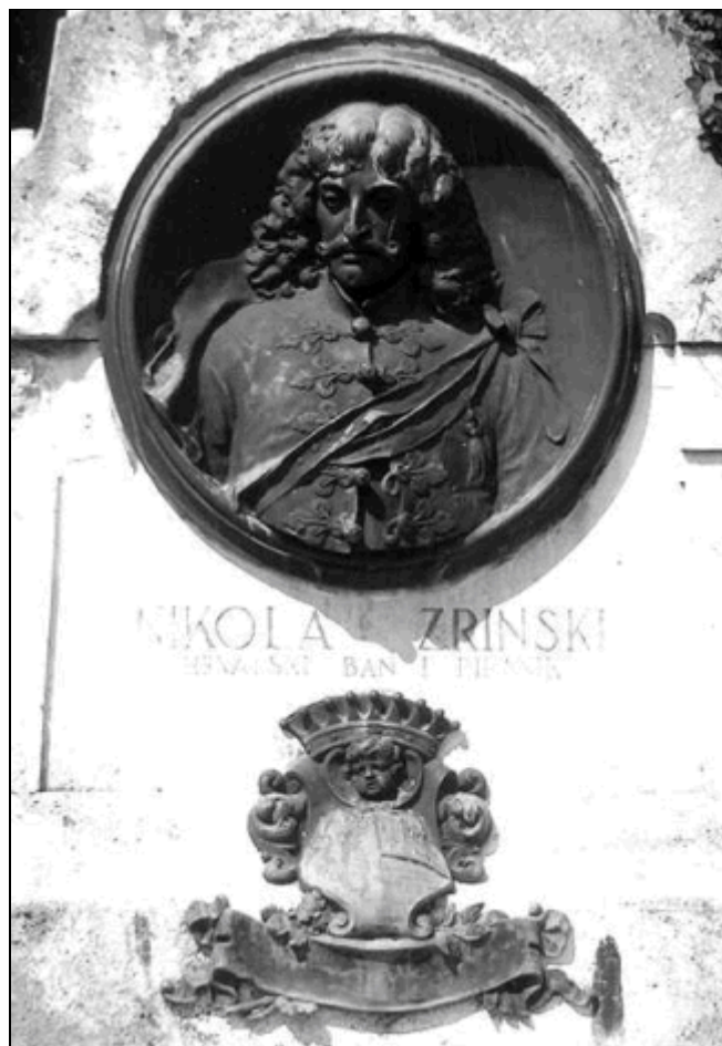
10. kép: A Zrínyi-emlékoszlop