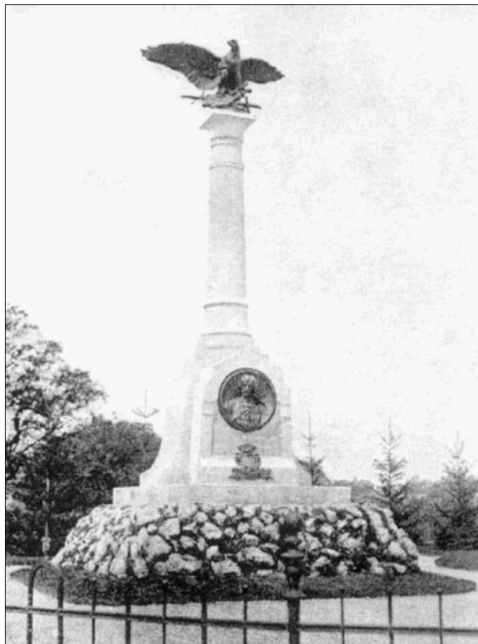
4. kép: A Zrínyi-emlékoszlop (Zrínyi Károly: Csáktornya monográfiája, 1904)

Csáktornyán régóta nem volt olyan ügy, amely iránt oly általános érdeklődést tanúsított volna a közönség minden rétege, mint a Zrínyi-emlékmű ügye iránt. Ezt a Muraköz hasábjain is leírták 1904-ben: „De hirdesse azt is, hogy itt, az imádott magyar haza kettős határán egy nép él, mely hű maradt az ő hajdani urának tradícióihoz.”