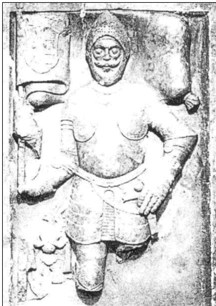
11. kép: A Zrínyi-sírkő