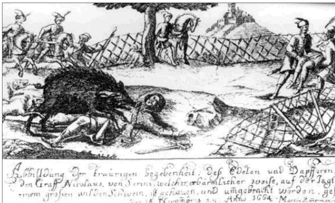
8. kép: Zrínyit végzetesen megsebzí a vadkan, bal lábszárán jól látható a seb.

Vadkan vagy orgyilkos áldozata lett-e Zrínyi Miklós? Ezt a kérdést igen sokan felteszik manapság is, noha ismerik a történelemtudomány választát. Pedig e problémakörben nem csupán a halál okának tisztázása a fontos, hanem a különféle mendemondák eloszlatása is. „A nemzeti köztudatba szilárdan beépült »magyar hős-Habsburg orgyilkos« eszmei panele gyakran elfedi a régenvolt események valódi lefolyását, megakadályozza a reális történelem- és nemzetszemléletet.” - írta Bene Sándor és Borián Gellért 11 Zrínyi és a vadkan c. 1988-ban kiadott tanulmánykötetük fűlszövegében. Szokoly Lajos a 19. század végén is érdekesnek tartotta Zrínyi Miklós rejtélyes halálát, amelyről 1894-ben három részből álló sorozatot közölt le a Muraköz hasábjain, 230 évvel a költő tragikus halála után.