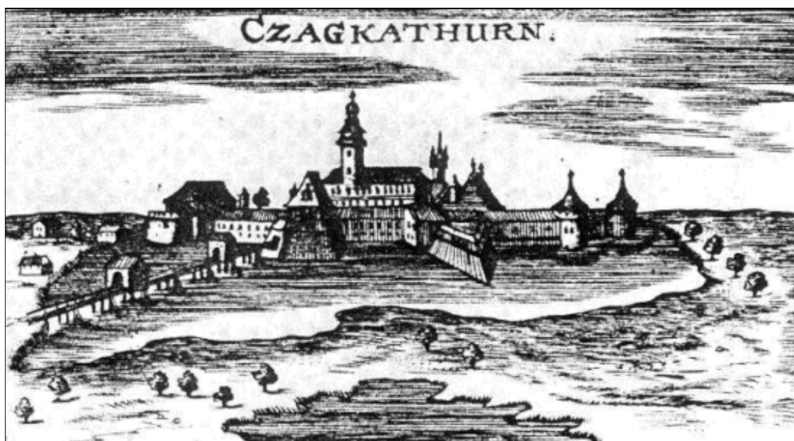
6. kép: Csáktornya látképe (XVII. század) - rézmetszet

A Muraköz 1882. június 5. IX. évf. 23. számában a Régi okiratok sorozatában jelent meg egy okirat, amelyben a muraközi nemesség és a vitézlő rendek 1631-ben húsvét táján levélben fordultak gróf Zrínyi Miklóshoz és gróf Zrínyi Péterhez, mert Csernko Gáspár otthona, vagyona és jószága elégett, s ezért szükségesnek tartották a kártérítést. Továbbá Pápai Zakariás és Schittkovics Ferencz is kéréssel fordultak Bottyai Ferencz vitéz úrhoz, vagyis: „Kanizsa ellen vetett végh hazánknak vice Generálisához és Egerszegh végh háznak fő kapitányához.”