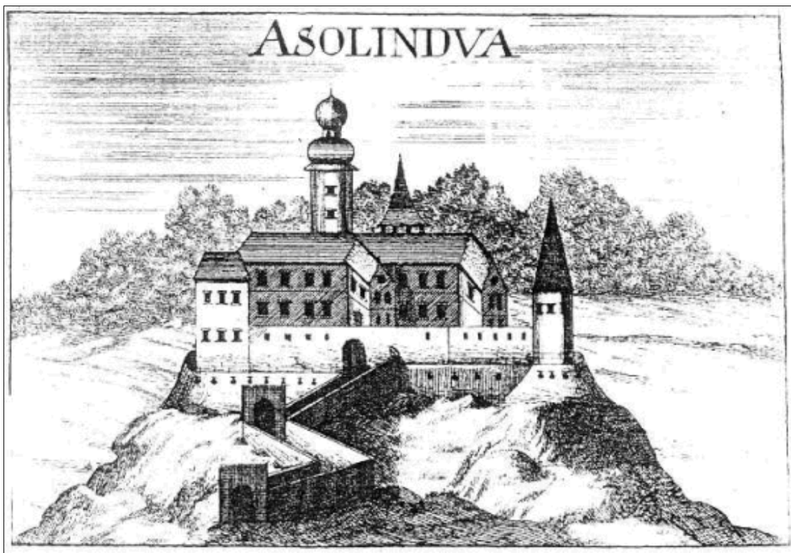
1. kép: Alsólendva vára (XVII. század) - rézkarc

„Az alsólendvai várnak ekkor Bánffy Kristóf volt az ura és parancsnoka is, a hajdúk útján július 9-én értesült, hogy 6000 főnyi portyázó török-tatárhad, Sinán Küprili aga és egy tatár chán vezetése alatt roppant dús zsákmánnyal terhelve, Vasmegyén keresztül Steier országból erre tart és Letenyén át, a nagykanizsai várba iparkodik s legkésőbb 11-én (1603) már ide érkezik és a törökök által annyiszor hiába ostromolt »Lindva várát« míg be nem veszi, tovább nem megy.”