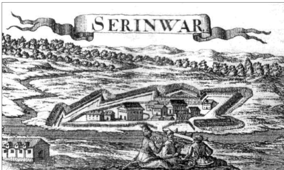
9. kép: Zrínyi-Újvár, Justus van der Nypoort rézkarca. 1686.

jobb partjára épült, szembe Novigraddal, amelyhez közvetlenül híddal csatlakozott. A kőből épült erődítménynek négyszögletű alaprajza volt. Mellé kanálist is ástak, amelyben víz folyt. Az erődítményen belül harminc ház épült. Új Zrínum verhetetlenségéről vált híressé Horvátország határszélén és Európa-szerte. 1664-ben 200 ezer török támadta meg Kanizsát, majd Új Zrínumot is. Gróf Montecuccoli szerint „kő-kövön” nem maradt belőle. 1752-ben Josip Bedeković még látta a vár maradványait, de ma már ezek sem találhatók meg. Dolnja Dobraván Zrínyi-szögnek nevezik ezt a helyet. Erről olvashatunk újságcikkeket a Muraköz-Medjimurje 1888. március 11-i V. évf. 11. számában.