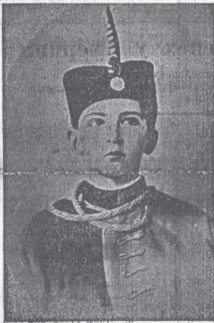
Њ. В. ПРЕСТОЛОНАСЛЕДНИК ПЕТАР Старешина Савеза Сокола Краљевине Југославије

И ми, васкрсени надама будућности, видимо и осећамо искрену радост и понос Југословенског народа у телесном и душевном развоју узвишеног Детета. Народ увек са највећим интересовањем прати живот Краљевске деце и у сваки њихов покрет удире хиљаде погледа, у своје нове млађе вође. Њихов живот је живот савиј нас; њихова способност је срећа читавог народа. Но радост је толико већа што се прославља рођендан најузвишенијег Детета наше нације.