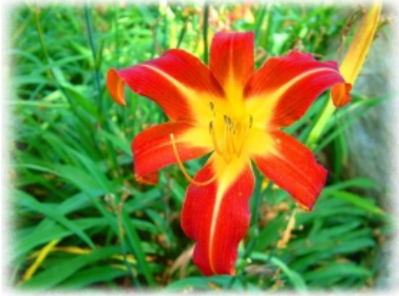
A Szerelemvirág természetesen piros