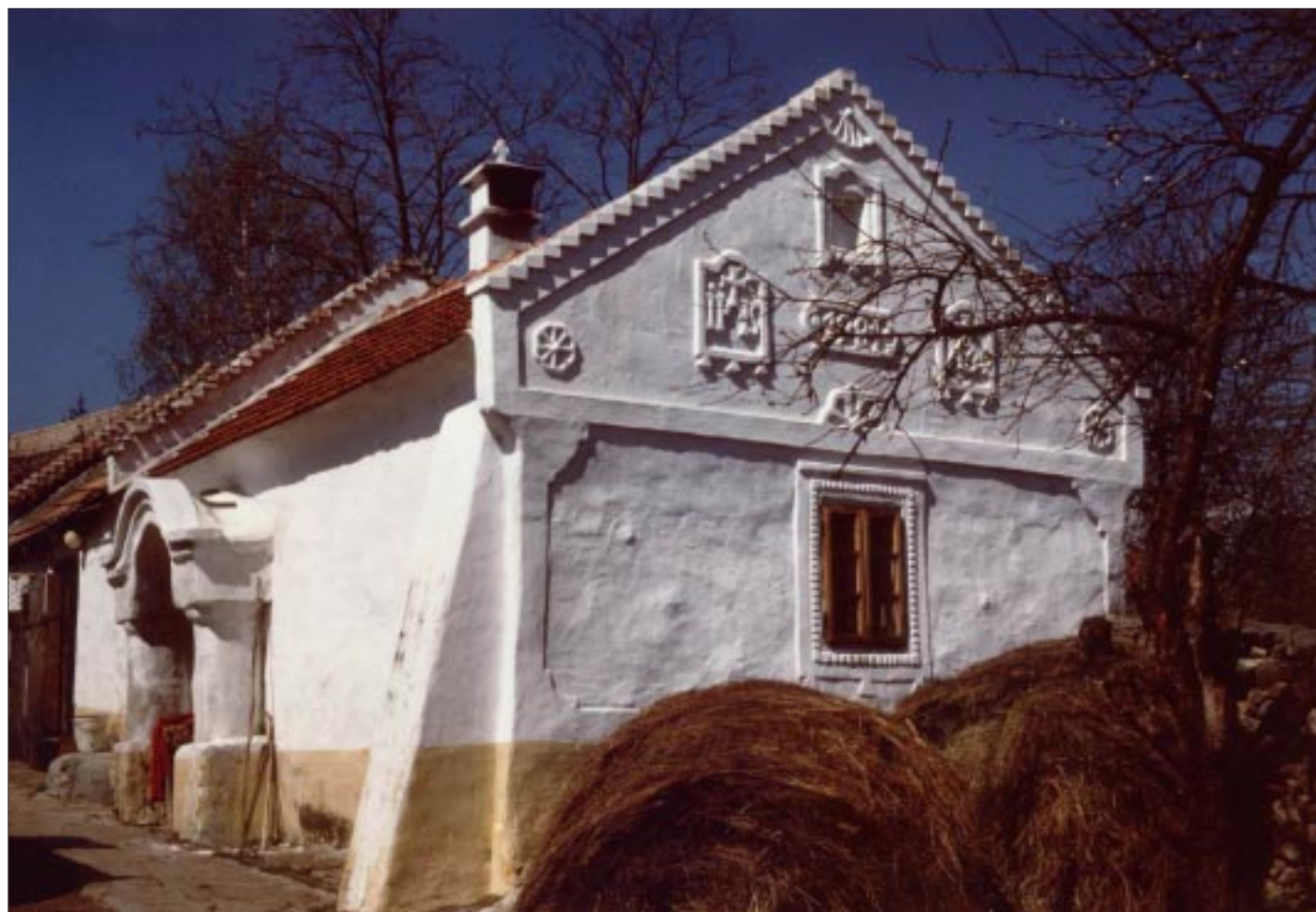
Olasz Ferenc: Salföld