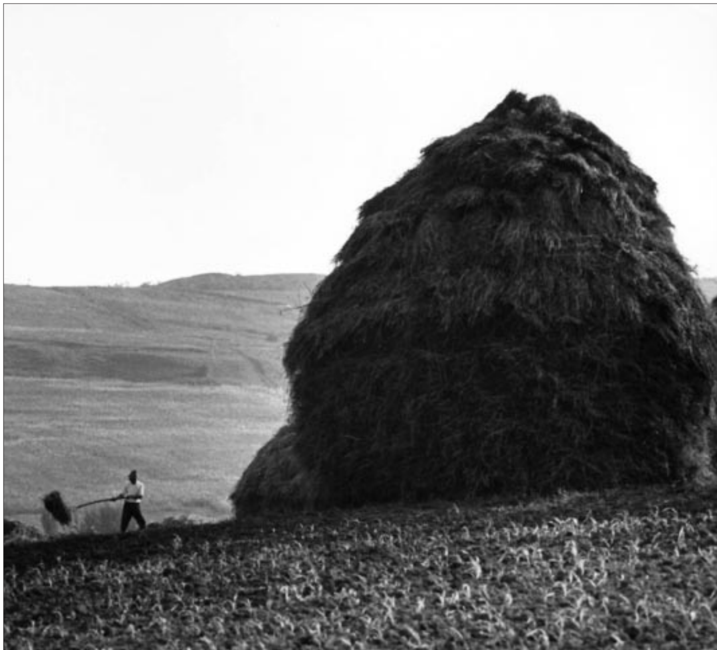
Korniss Péter: Szék