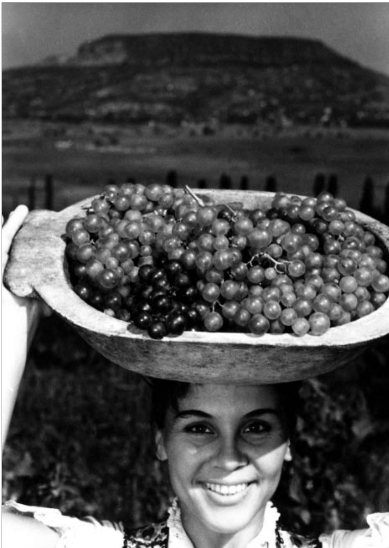
Gink Károly: Megáldalak, hogy áldás légy