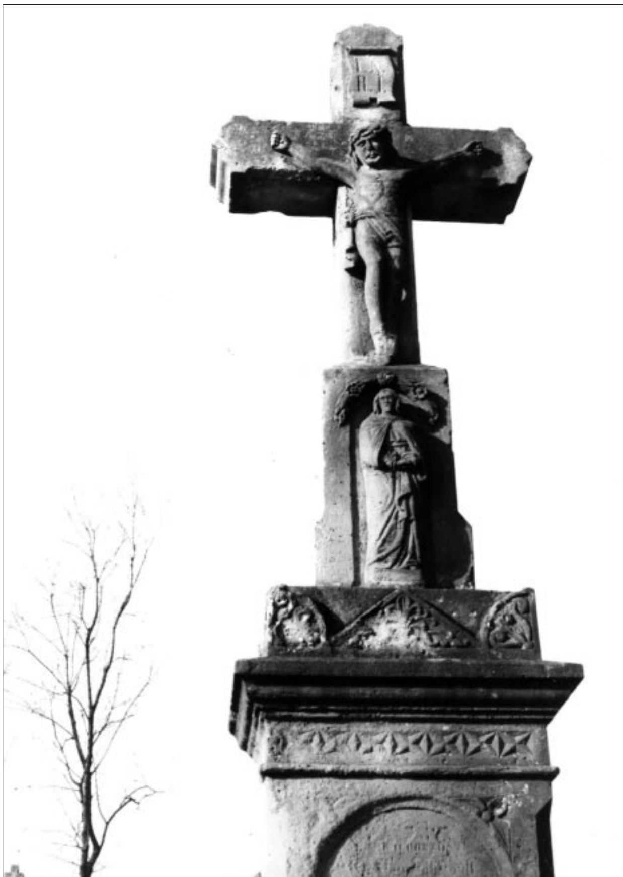
Olasz Ferenc: Alsópáhok