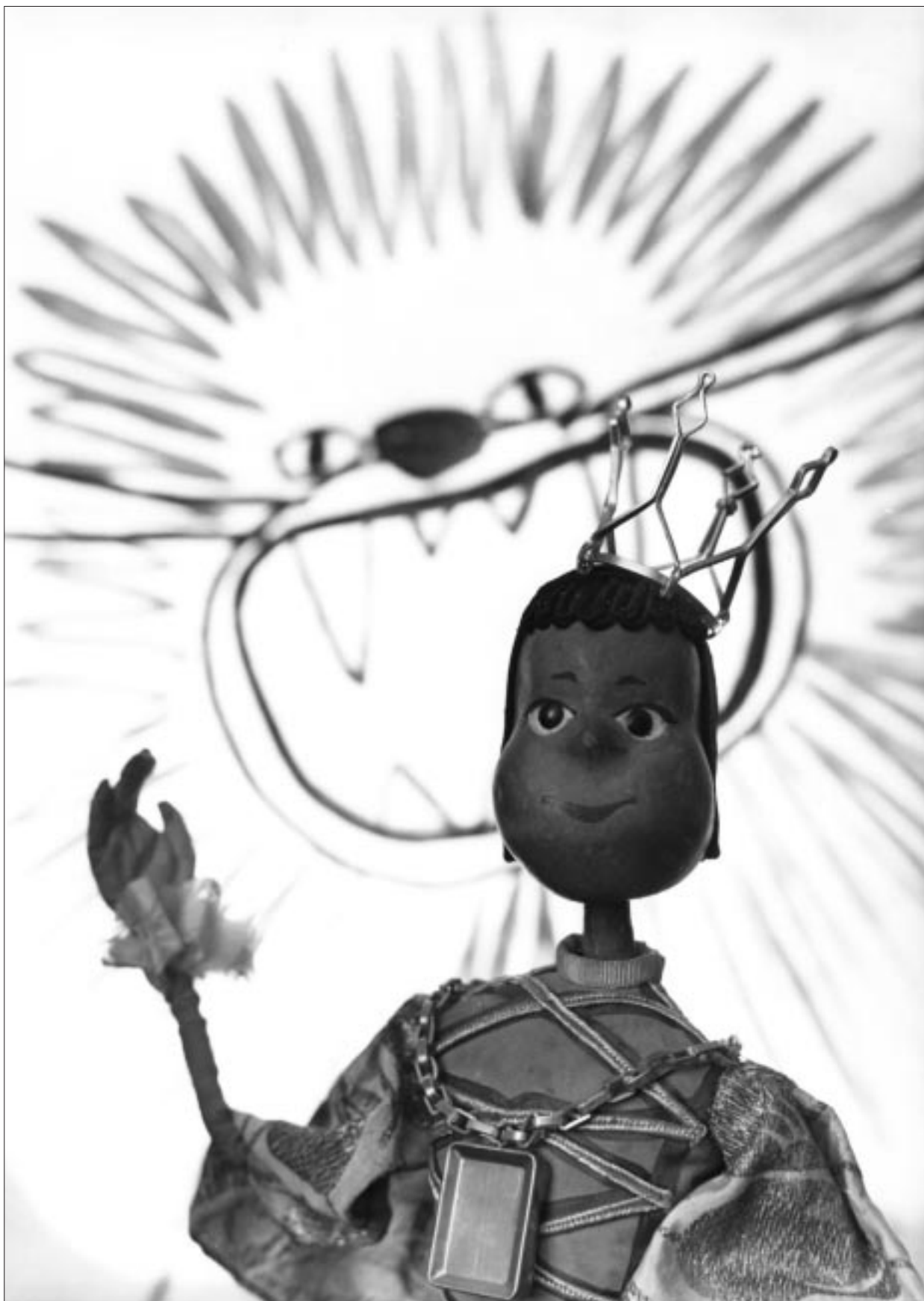
Gink Károly: Cendrő királyfi