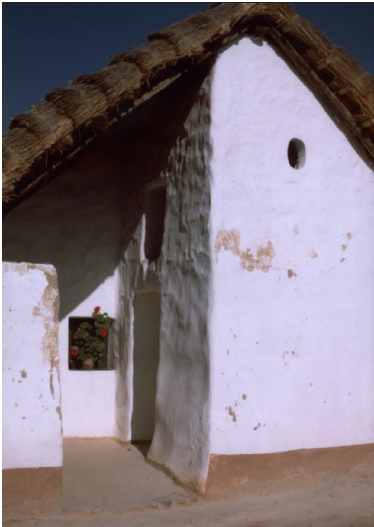
Olasz Ferenc: Kékkút