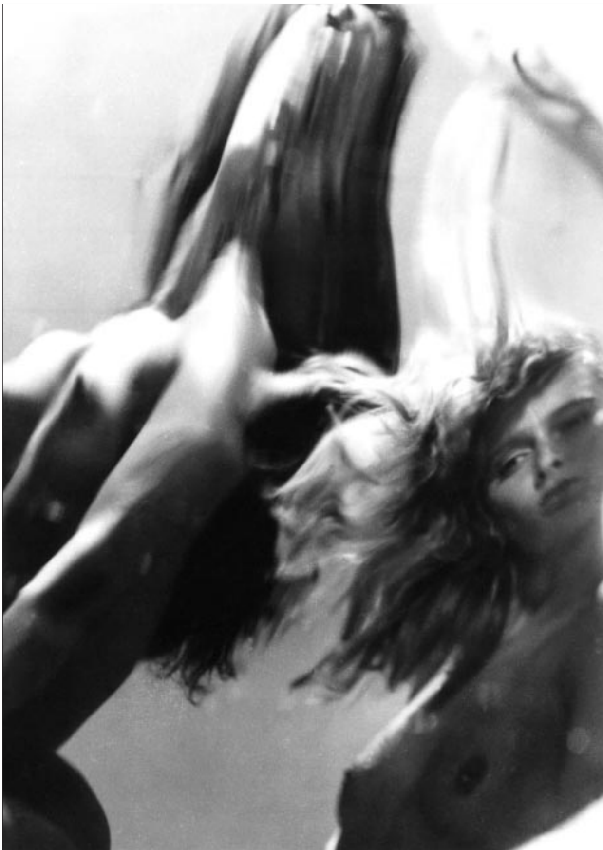
Gink Károly: Delejes szépségek 1983