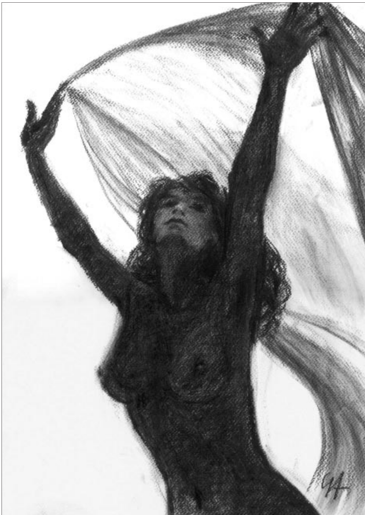
Gubcsi Attila: Szép új világ