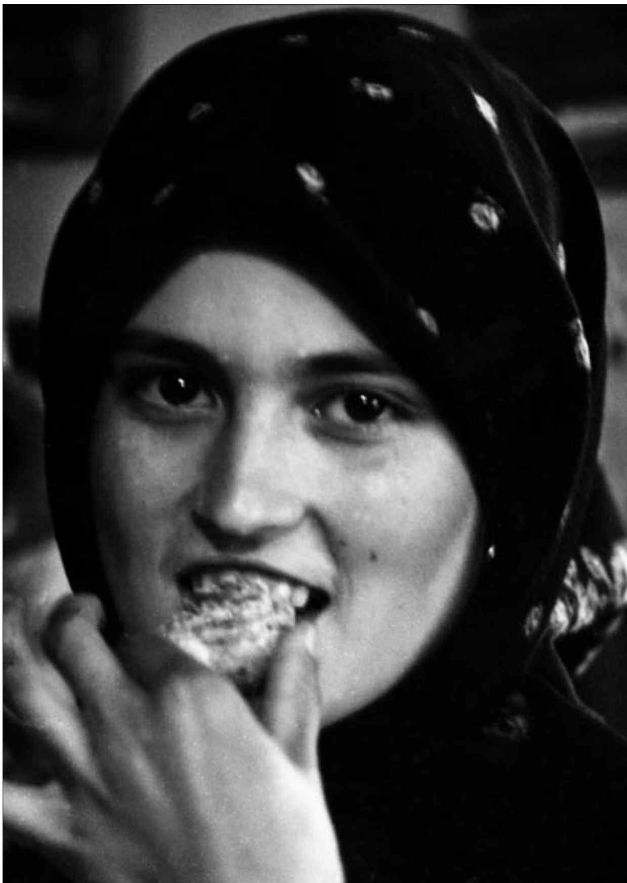
Korniss Péter: Szék