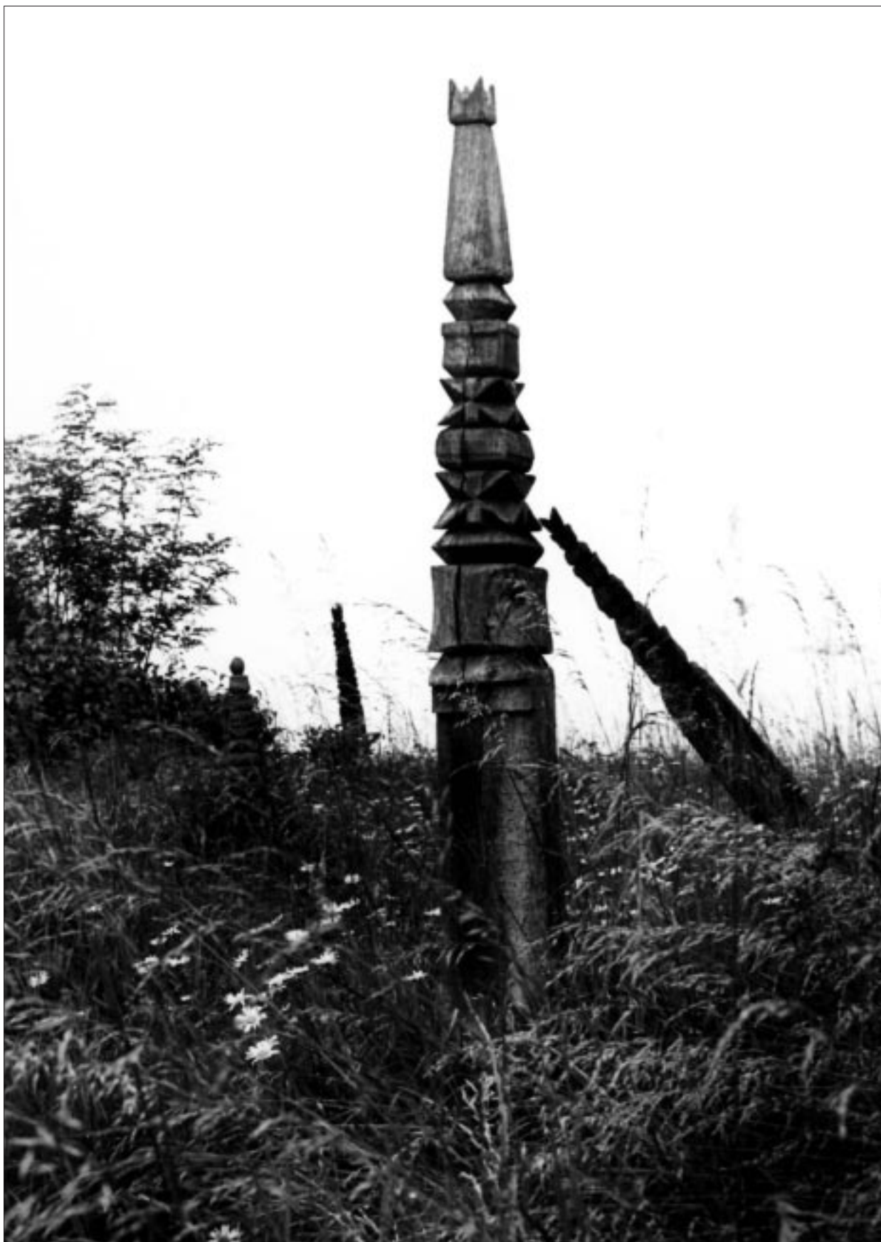
Olasz Ferenc: Erdőfüle