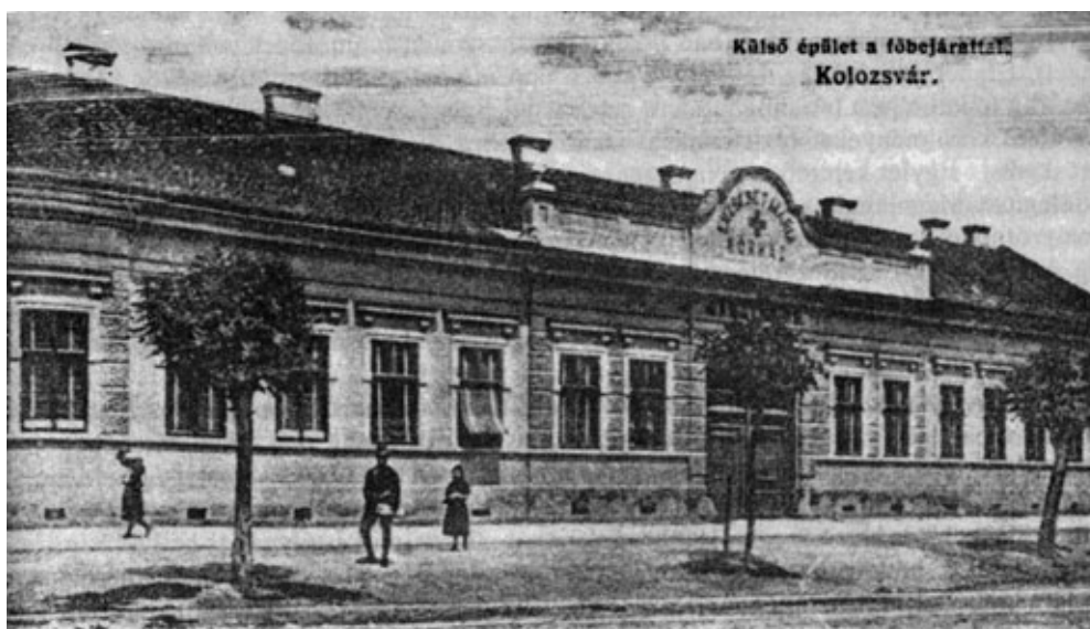
Az egykori Vöröskereszt Kórház (73. sz.) 1900 körüli képeslapon