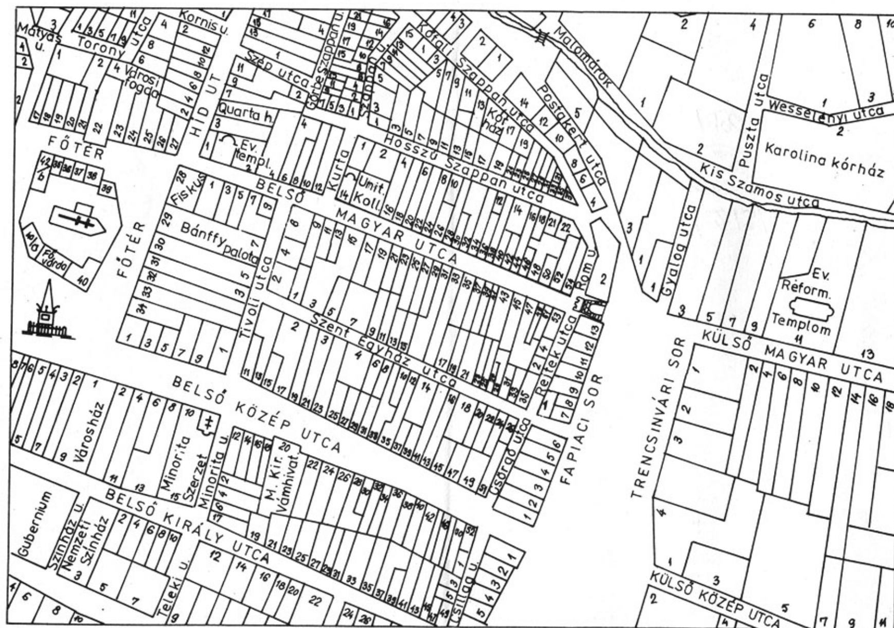
I. A Belső Magyar utca telkei Kolozsvár első, 1869-es Bodányi Sándor-féle telekkönyvi térképéből