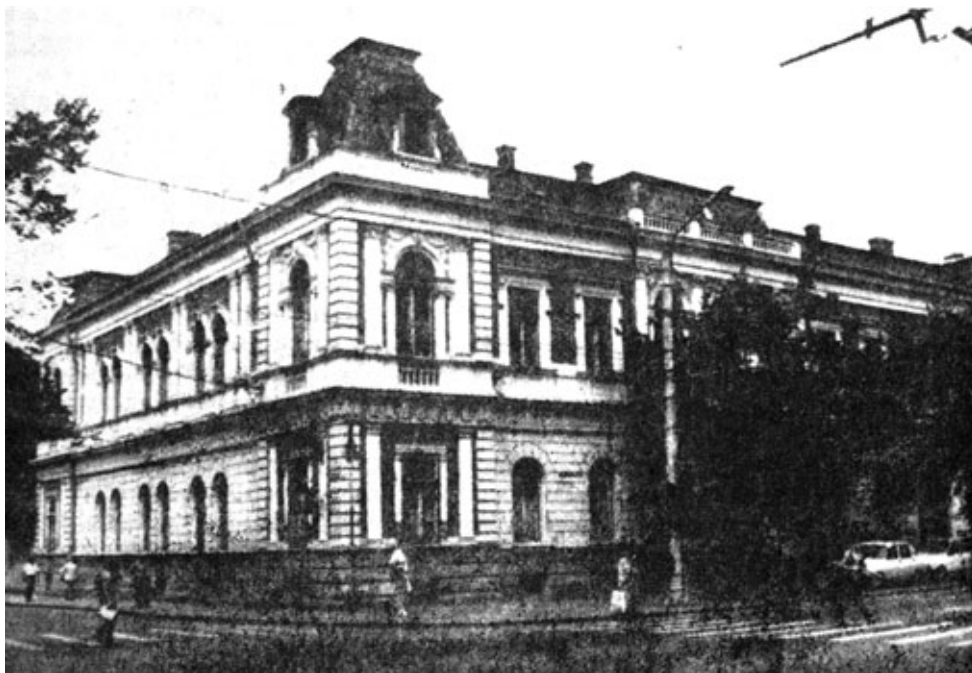
A reformátusok sarokháza (37. sz.)