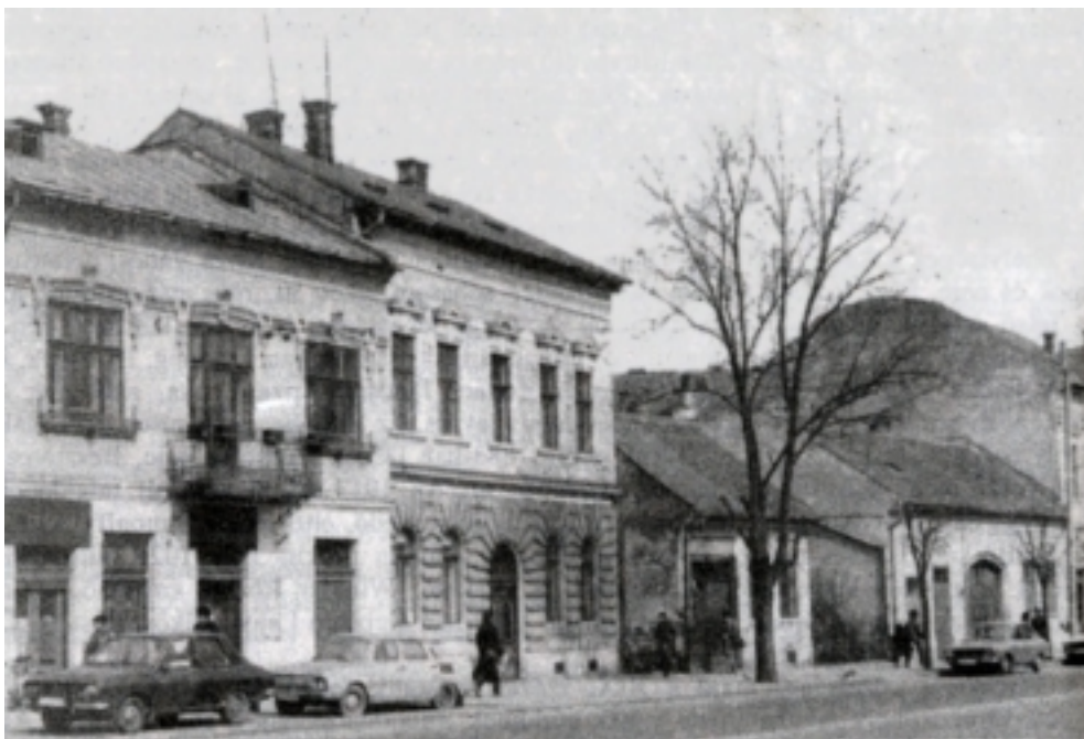
A Tamási-háztól a Nyerges-házig (23–31. sz.) a bontások előtt

Nyerges családtól, de benne laknak az 1984-es lebontásig. E ház frontja még elég jó állapotban volt, de két udvari szárnya (közöttük keskeny udvarral) meglehetősen romladozó, nyirkos, egészségtelen benyomást keltett.