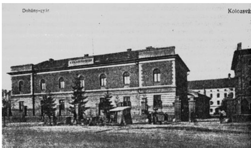
A Dohánygyár (77. sz.) 1900 körüli képeslapon