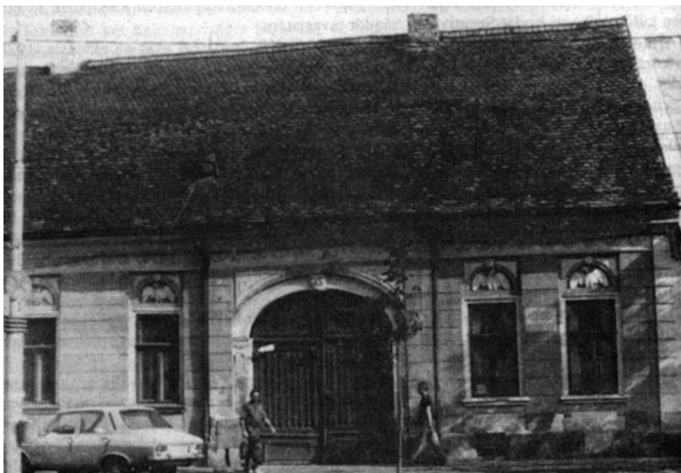
A Simó-ház (20. sz.)

E házakkal lezárul az utca unitárius szakasza, jóllehet a XIX. század végéig a következő házak jó részének is unitárius tulajdonosai, bérlői voltak, akik házuk eladásakor azt legtöbbször megvételre felkínálták az egyháznak is.