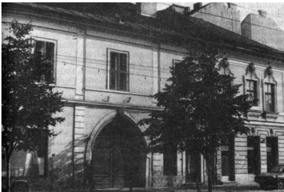
Az unitárius tanári szegletház és a püspöki lak