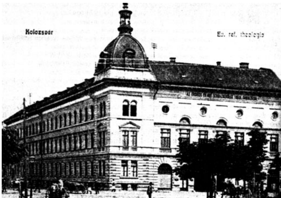
A református teológia 1900 körüli képeslapon