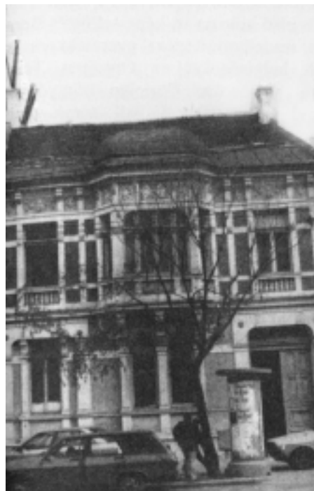
A Hory-ház (50. sz.)