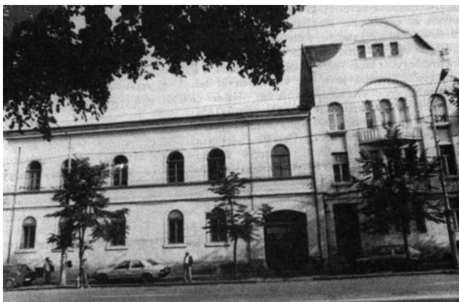
Az Ács-ház (34. sz.) és a Bethlen-palota (36. sz.)