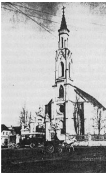
A szentpéteri templom 1940 körül