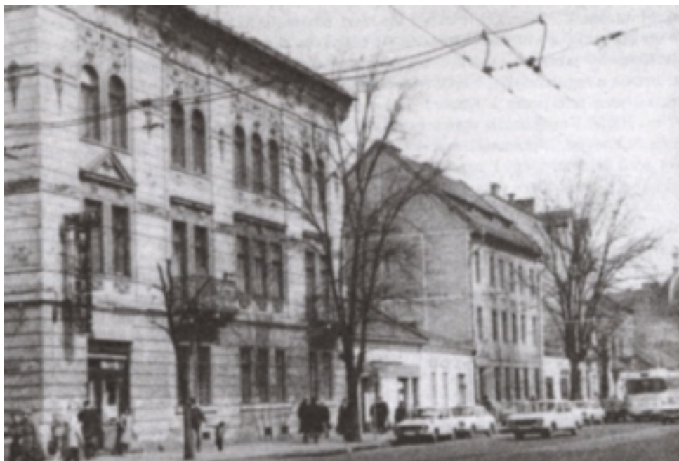
A Haller-háztól a pénzügyőr laktanyáig (11–17. sz.) a bontások előtt