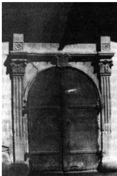
Feliratos reneszánsz ajtókeret a Groisz-házból (32. sz.)