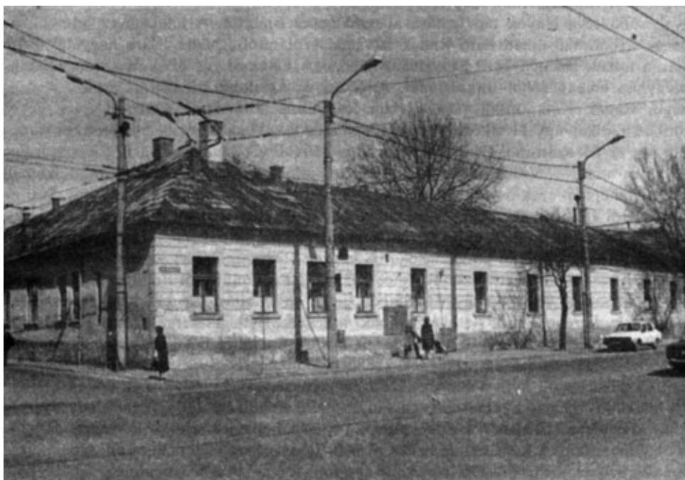
A Radák-ház (53–55. sz.)