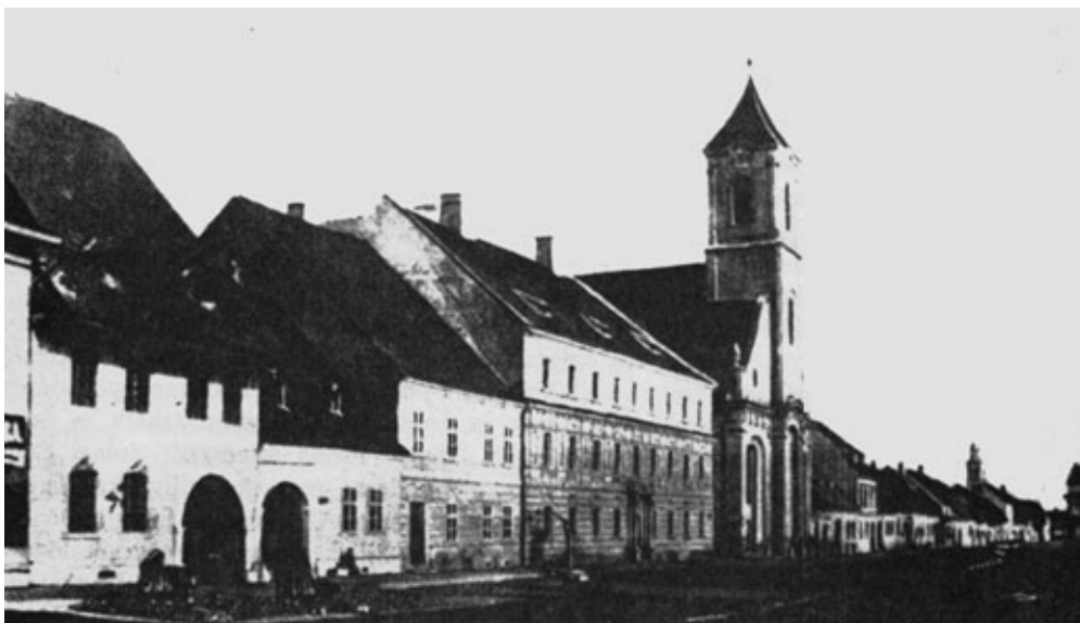
A régi Unitárius Kollégium és a templom 1859-ben

Magyar utca felőli szárnyat 1780 őszére rendbeszedik. A sikátor felőli szárnynak azonban az alapja annyira gyenge, hogy teljesen új alapozásra van szükség, ehhez viszont újabb építési engedély kellett, melyet 1781 márciusában kapnak meg Bécsből.