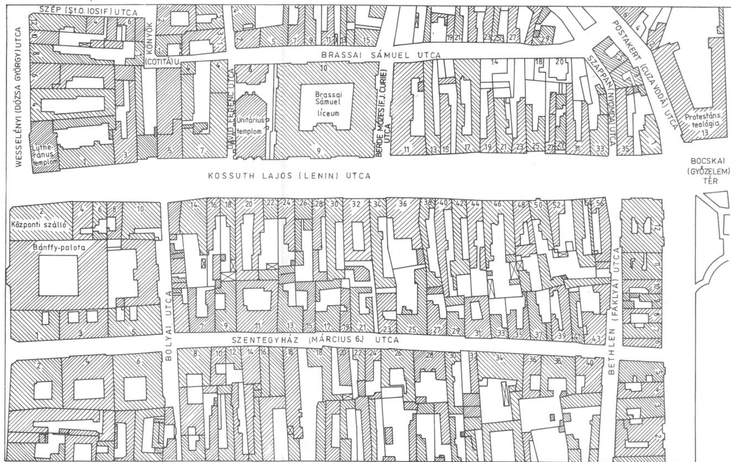
III. A Kossuth Lajos utca teleknyvi térképe (1970)