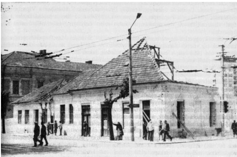
Megkezdődött a sarokház (35. sz.) bontása