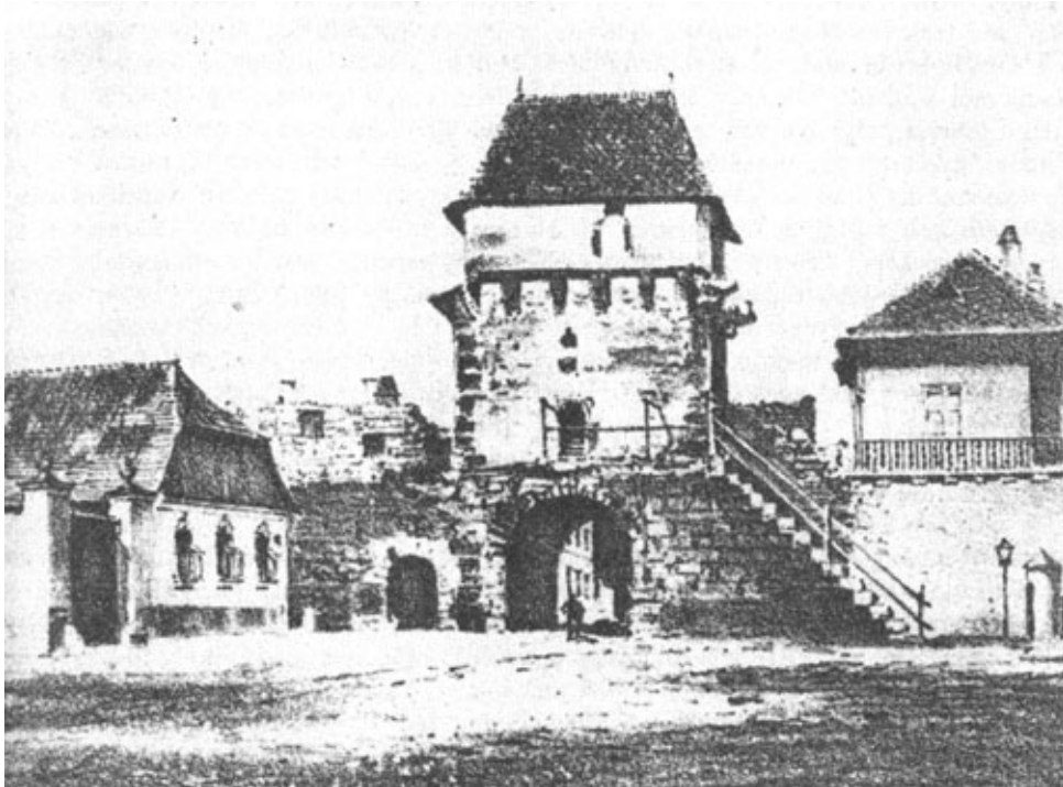
A Magyar kapu (metszet)