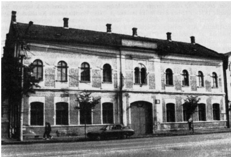
A hóstáti Református Elemi Iskola (124. sz.)