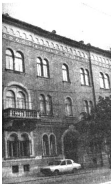
Az Eperjesi-ház (60. sz.)