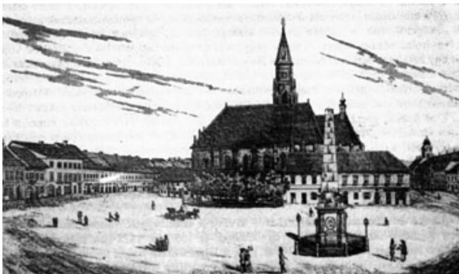
A Főtér látképe az 1870-es évekből (metszet)