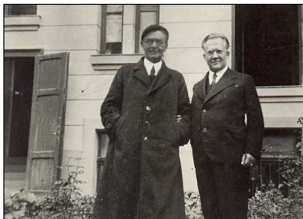
Karl Barth kolozsvári látogatása alkalmával készült, szintén a Protestáns Teológiai Intézet udvarán