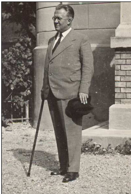
Kolozsváron készült, valószínűleg a Protestáns Teológiai Intézet udvarán