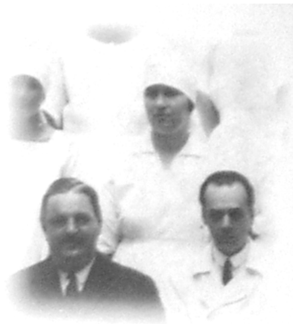
Részlet a képből