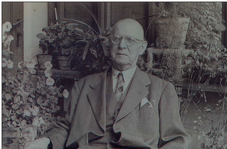
MÁLNÁSI BARTÓK GYÖRGY (1882 — 1970)

Ezen felvétel 1960. augusztusában készült Budapesten. A felvétel Tóth Miklós tulajdona.