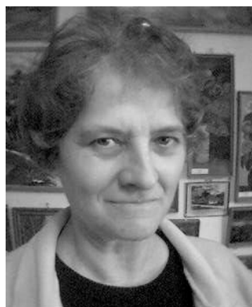
Popity V-né M. Kinga