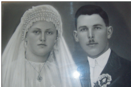
Házaspár a XX. század 30-as éveiből