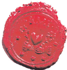
Az 1764-es községi pecsét

Az 1761. évi egyházlátogatási jegyzőkönyv mindezt megerősíti. Valószínű, hogy ekkortájtban épülhetett a gyülekezet imaháza, ugyanis a helytartótanács 1753-tól megtiltotta az artiku-