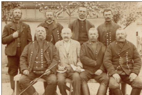
A község elöljárósága 1911-ben

1918 Az első világháború 26 kisújfalusi lakos halál- látkövetelte