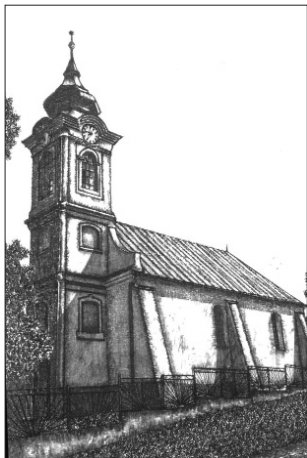
A református templom