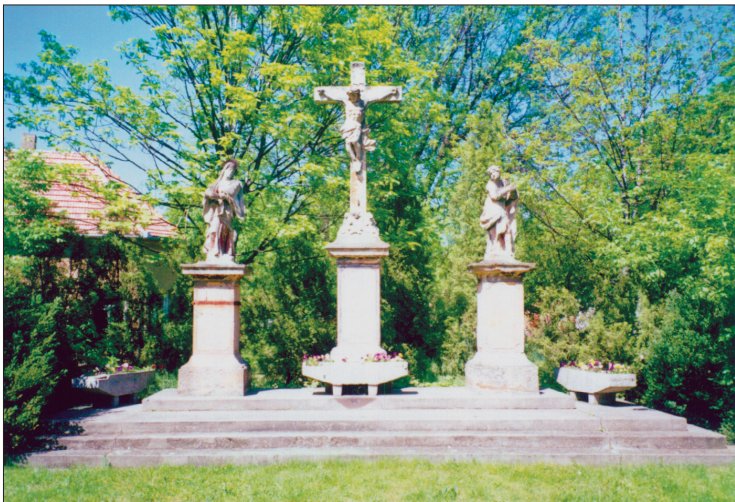
Barokk kálvária 1766-ból

sok vitézét elvesztette ugyanitt. E csatározások magyaros virtusát Mikszáth Kálmán is megörökítette „Az aranyos csikó” c. helyi vonatkozású elbeszélésében. A tizenötéves háború elején, 1594-ben a császári seregek megpróbálták visszafoglalni a töröktől Esztergomot és Párkányt. Gróf Pálffy Miklós és József főherceg hadivállalkozása azonban balsikerrel végződött. Esztergom ez évi ostrománál halt hősi halált Balassi Bálint. Egy évvel később Mansfeld Károly és Pálffy Miklós bevette ugyan a két erődítményt, de Párkány a harcokban teljesen elpusztult, Pálffy azonban újjáépíttette. Esztergom és Párkány csak tíz évig maradhatott császári kézen: 1605-ben Ali pasa visszafoglalta mindkét erődítményt. Ekkor írta keserűen Illésházy István főudvarmester Thurzó Györgynek: „és nimetre az végházakat ne bizzuk, ám Esztergomot is feladták, az többit is mind németek adták török kezében, nekik nem hazájok, nem fáj nekik...” A zsitvatoroki béke (1606) szentesítette a török hódítást.