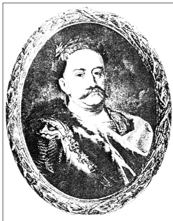
Sobieski János lengyel király

tesz a településről, a garamszentbenedeki apátság 1075-ből származó – I. Géza király által kiadott – alapítólevele, amelyben az uralkodó a Kokat felső részében lévő tíz révészházat és három ekényi szántóját az apátságnak adományozza. További okiratok II. Géza és II. Endre korából az itteni sóvámról és kikötői vámról rendelkeznek. 1189-ben nem akármilyen vendég látogatott Kakathra és Esztergomba: maga Rőt-szakállú (Barbarossa) Frigyes, német császár. III. Béla király felesége – Margit – a harmadik keresztes hadjáratot vezető császárnak hatalmas sátrat adományozott, amelyet Kakathon állítottak fel tiszteletére.