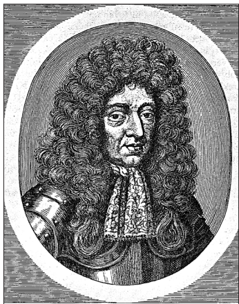
Lotharingiai Károly herceg