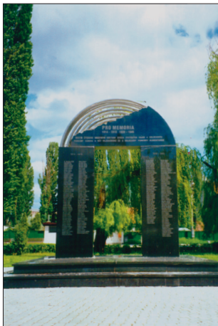
A két világháború és a Holokauszt helyi áldozatainak emlékműve (Szilágysági Tibor alkotása)

dékeikkel és páratlan oszlopfőikkel vonják magukra a figyelmet.