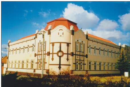
A járásbíróság épülete (épült az 1900-as évek elején)

A vásárok. Már a középkorban meglévő vám- és révjog mellé később a település vásártartási jogot szerzett, amely gyakorlatilag városi jogállást jelentett Párkány számára. Ennek révén vált „oppidum”-má, azaz mezővárossá már a törökkorban. Békeidőben a törököknek is érdekükben állt a normális gazdasági élet és a cserekereskedelem fenntartása. Ezért nem meglepő, hogy már a 16. század végén kezdeményezték a párkányi vásárokat. 1598. március 20-án az alábbiakat írja Pálffy Miklós érsekújvári generális főkapitánynak Memy bég: „Mi azt gondoljuk, hogy a földnek épületére így leszen jobb, hogy itt Kakathon mindön héten vásár legyen és ismét főszakadalmak is legyenek, kire mindenfelől bízvást jöhessenek és mehessenek és az miből pénz tereomthetnek, mindönöket áruljanak és vegyenek...”