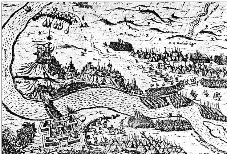
Esztergom és Párkány ostroma, 1594

fejlődését. 2005-ben a város főtere is teljesen megújult. Az uniós forrásokból épült sétálóutca a város idegenforgalmi vonzerejét növeli.