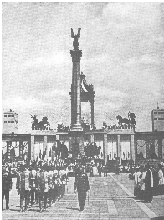
5. A Szent István év megnyitása