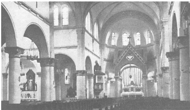
3. A Szentlélek templom belülről