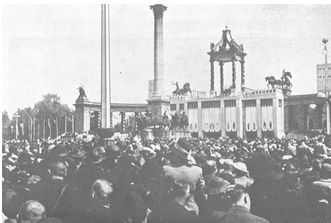
4. A Hősök tere a pápai legátus miséjén