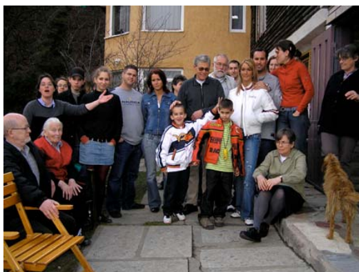
Családi összejövetel 2005 húsvétján

Természetesen a fent említett helységek sorát még számos másikkal lehetne kiegészíteni, hiszen a Podmaniczky család közelebbi és távolabbi hozzátartozóinak sok egyéb településsel volt/van szoros, illetve kevésbé kapcsolatuk. Annak ellenére, hogy a rokonságban akadnak olyanok is, akik ma már nem Magyarország területén élnek, s esetleg nem is magyar származásúak mindkét részről, a családi kötelékeket a lehetőségekhez mérten ápolják.