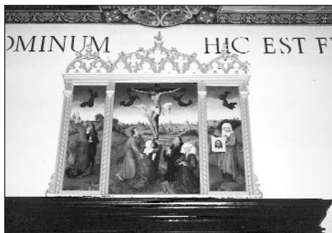
A keresztfeszítést megőrkítő triptychon