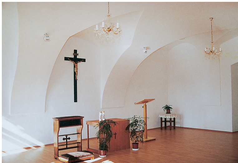
A kastély belső tere