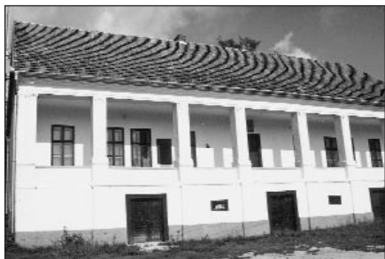
A régi egyházi iskola

hogy istenét háborítatlanul tisztelhesse benne, hogy a török portyázók lovaikat be ne kössék, s meg ne szentségtelenítsék“. (Höke L., 1868. 371.)