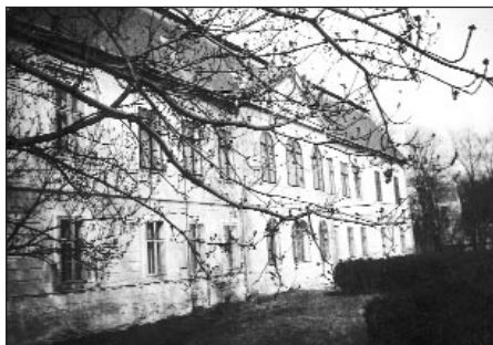
A Palásthy-kastély, ma egyházi iskola