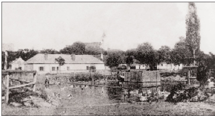
A község központja a termálvízű kis tóval és a nyilvános kórházzal (1910)

A község határa eredetileg királyi szőlőtermelő birtok, melyből az egyházak adományokat kaptak. Szent István király uralkodása idején különféle nemzetségekkel együtt a zabori apátság birtokolt itt földeket; erről a Kálmán király 1113-ból származó újabb határleírásában történik említés. Ezen okirat szerint I. Géza király 1075-ben bizonyos birtokokat ajándékozott a szentbenedeki apátságnak (6 eke földet, 15 szolga házát és 16 szőlőföldet). A község itt Pagran név alatt szerepel. Az apátság e birtokait 1209-ben a pápa erősítette meg. Az „orosz” László birtokában lévő szőlőföldeket László halála után II. Endre király az esztergomi érseknek ajándékozta; 1232-ben Róbert érsektől elkobozta és az egyháznak adta, de még ugyanabban az évben vissza