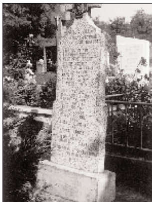
Az I. világháború áldozatainak eemlékműve

delkező magyar tanítási nyelvű alapiskola működik. 1920 után elkezdődött a tanítás a szlovák tannyelvű iskolában is, amelyet Czillingék házában helyeztek el. Földszintes ház, alaprajza L alakú. 1945 után a szlovák tanulókat a magyar tannyelvű iskola épületébe helyezték át. A községi hivatal mellett 1993-ban befejezték az óvoda építését, de bizonyos idő után az 1.-4. osztályos szlovák tan nyelvű alapiskolát költöztették be ebbe az épületbe.