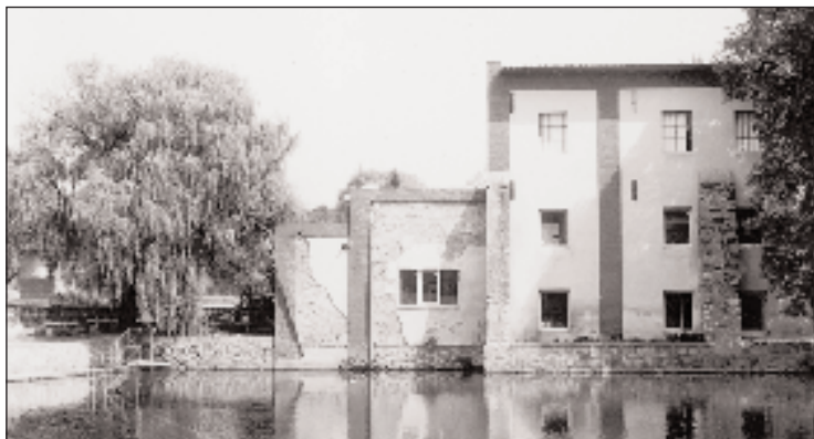
Az Aujeszkyek volt malma

felében lebonyolított beépítés a régi elrendezéshez kapcsolódik, csak bővíti azt. Néhány udvarban jellegzetes emeletes galambházak vannak. Erre a katolikus községre jellemző, hogy a házak homlokzati részén szoborfülkék vannak, ezekben vannak elhelyezve védőszentjeik szobrocskái (a 152-es házszám alatt Jézus Legszentebb Szíve újabb, eredetileg itt faszobor volt, a 94-es és 155-ös szám alatt Szeplőtelen Szűz Mária, a 96-os szám alatt Lourdesi Szűz Mária, a 101-es szám alatt Jézus Krisztus képe, a 395-ös szám alatt Jézus Legszentebb Szíve). Hasonló szoborfülke nagyon sok van a községben, sajnos több közülük üres (pl. a 402-es házban). 1945 után a négyzet alaprajzú házak a kertekben épülnek a község eredeti magván kívül. A szőlőskertekben megmaradt néhány régi borospince és bódé a jellegzetes halmazos beépítéses alakzatban. A pincejáratok több esetben itt is gádorral vannak kihangsúlyozva. A temetőben a 19. század második feléből fennmaradt néhány fából készült sírkereszt , a rájuk erősített kis pléhszívben az elhunyt nevének kezdőbetűivel. Fennmaradt néhány öntöttvas-sírkereszt is. A Csipkés és Káka nevű dűlőkben az elkülönített péróban lakó cigányok vályogot vetettek . Ez a tevékenység azonban az I. Csehszlovák Köztársaság évei során fokozatosan megszűnt.