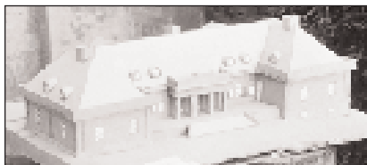
A Jánoky-kastély Egerpusztán

nyitrai káptalanok.” A község fejlődését előrejelzi, hogy 1871-ben egy téglagyár és négy malom működött itt. 1883-ban a tűzvész 23 hajlékot semmisített meg, 1887-ben 2 ház égett le, 1897-ben 15 ház és 5 gazdasági épület, s 1898-ban ismét tűzvész pusztított. 1888-ban Pográny a FEMKE szervezet tagja lett. 1894-ben megalakították a helyi hitelszövetkezetet. 1905 körül megalakult a fúvószenekar. 1906-ban ismét tűz ütött ki a községben. 1910 körül megalakították az önkéntes tűzoltótestületet. 1911-ben Pogrányban új malom épült fel. A község fejlődése az I. világháború éveitől (1914-1918) megtorpant. A háború harcterein 20 lakos esett el. Pográny történetében fontos fordulatot jelentettek az elkövetkező évek eseményei.