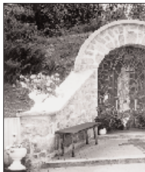
A Lourdesi b