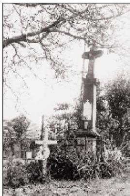
Út menti kereszt a 19. századból