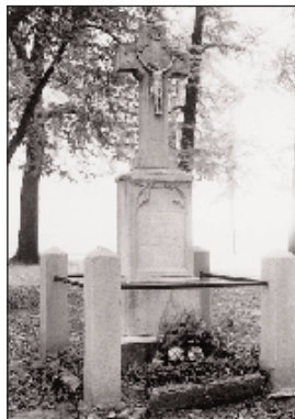
A róm. kat. templom melletti kereszt