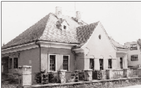
Az Auyeszkyek kúriája