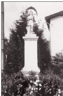
Szt. Vendel szobra

keresztre feszített színes (polikrómiás) Krisztus-testtel, ami kora barokk népművészeti munka a 17. század végéről. A barokk szenteltvíztartó a 18. század első feléből származik. A karzaton, amely három konvex-konkáv (domború-homorú megoldású) mellvédes árkádon nyugszik, 1837-ből származó orgona van elhelyezve; ezt a nyitrai káptalan költségén Klockner (Klokner) Károly pozsonyi mester készítette. Az orgona többszöri javítás után (legutóbb 1984-ben) ma is működik. Orgona már a 18. század 50-es éveiben is volt a templomban. A toronyban négy bronzharang van felfüggesztve. A nagyharang a Mindenszenteknek van szentelve, 1924-ben a nagyszombati Fischer testvéreknél öntötték, ugyanígy a kisharangot is, amelyet Szűz Máriának, az Egek Királynőjének szenteltek. A másik kisharangot is a Fischer testvéreknél öntötték 1896-ban, a Szentháromságnak szentelték, jól olvasható rajta a felirat: MILENIUMI EMLÉK.