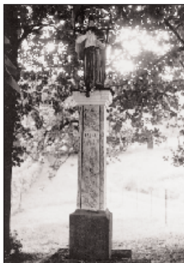
Szt. Orbán szobra