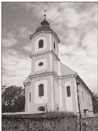
A római katolikus templom

is kapta őket. A tatárjárás előtti összeírások szerint több mint 40 szerviense (az uralkodó osztálynak a király szolgálatára kötelezett tagja) élt itt és szőlőföldek voltak. 1271-ben a Berencsi nemzetségbeli nemesek lemondtak alsógerencséri birtokukról, melyet János fiától kaptak. 1287-ben Debes fia, János lemondott pogrányi szőlőföldjeiről és szervienseiről Kőrösi Renold testvérének, Gerold (Gerult) fiának, Geroldnak a javára, ami 1300-ban volt írásba foglalva. 1318-ban a nyitrai káptalan panaszt tett, hogy az itteni jobbágyságot el-