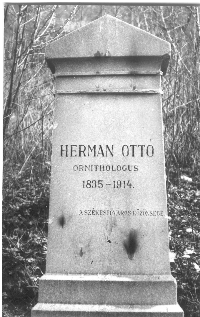
Herman Ottó korábbi síremléke a hámosi temetőben