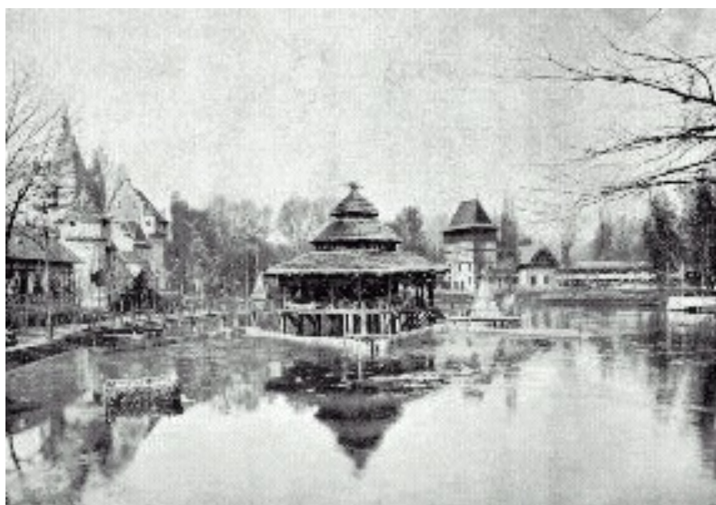
Az ezredéves kiállítás halászati pavilonja