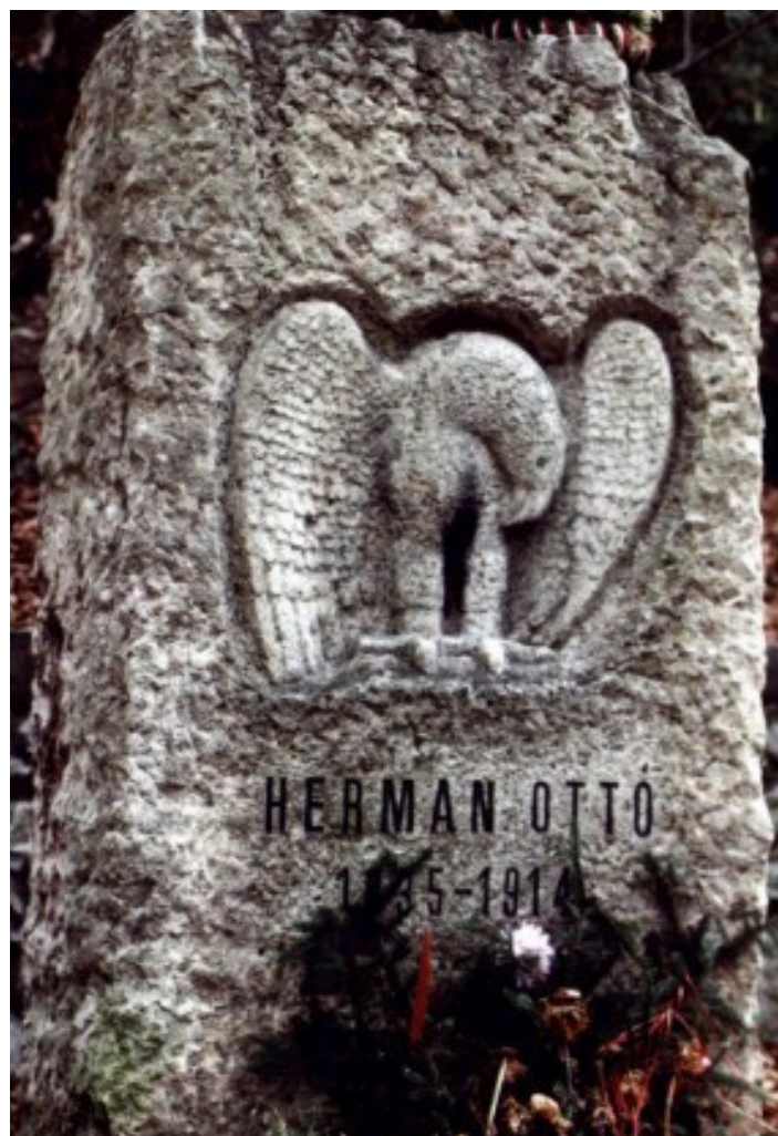
Herman Ottó síremléke a hámosi temetőben