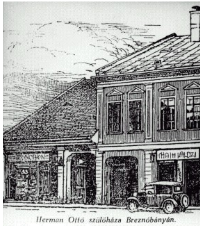
A szülői ház