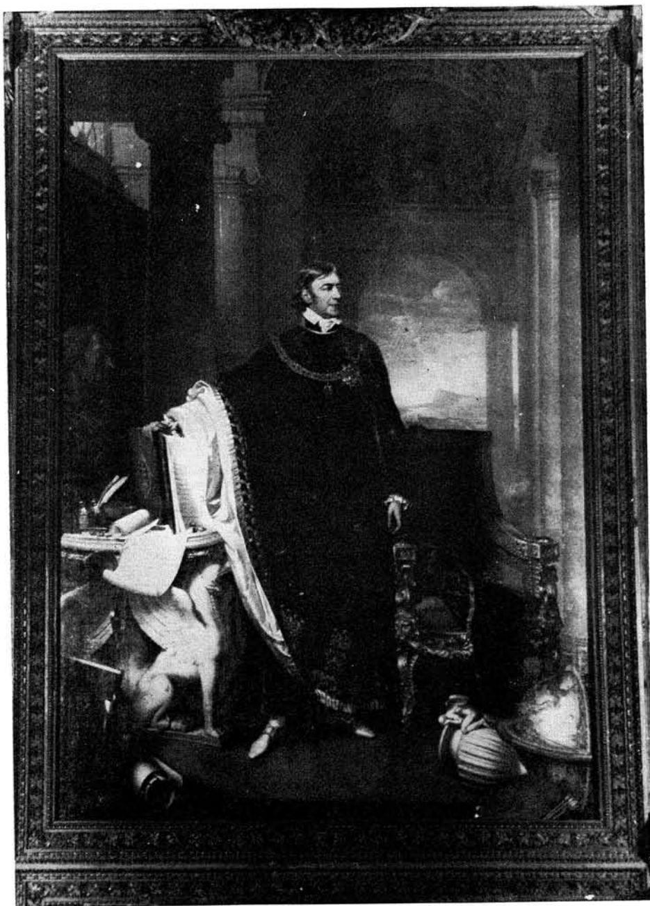
Széchényi Ferencnek Johann Ender által festett portréja a Könyvtár dísztermében

készített. E szerint a gyűjtemény 1791 kötetben 1766 nyomtatott művet és 25 kötet kéziratot tartalmazott. A könyvek túlnyomó részben XVII—XIX. századi német és francia tudományos, illetve szépirodalmi művek voltak s csak kisebb részben hungaricumok. A kéziratok anyagát a gróf személyéhez kapcsolódó dokumentumok alkották, irodalomtörténeti emlék csak egyetlen egy fordult elő közöttük, Zrínyi Siralmas panasza, alighanem késői másolatban. 401