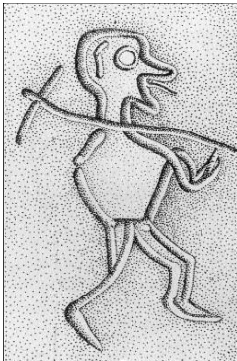
Féfit ábrázoló kőbe vésett kép

húzódó területet. A Dunától délre a Földközi (Jadranské) tengerig terjedő terület Illyricum római tartomány részévé vált, amelyből alighanem Claudius uralkodása idején (41-54) vált ki a később Pannónia néven ismertté vált tartomány. Trajánusz idején a tartományt két részre osztották - Pannonia Superior (Felső-Pannónia) központja Carnunte volt (a mai Bad Deutsch Altenburg és Petronell Ausztriában), Pannonia Inferior (Alsó -Pannónia) fővárosa pedig Aquincum (a mai Budapest). A Duna mint természetes akadály négy évszázadig alkotott határt a római birodalom és a nem római világ között. Az i. sz. 1. században keletkezett a Duna középső részénél a védelmi vonalak rendszere, az ún.