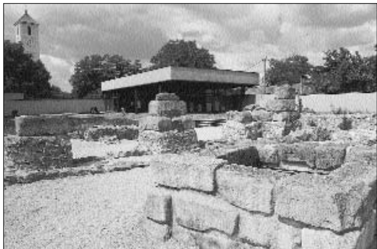
A múzeum látképe

gárságot - Civium Romanorum - is kaptak. Később az alatt Severianus és Gordianus császári házaival is emlegetik.