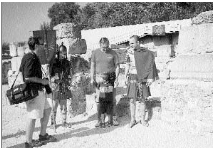
Az 1990. szeptemberében „Rómaiak a Dunán“ c. Európai Unió rendezvény résztvevői