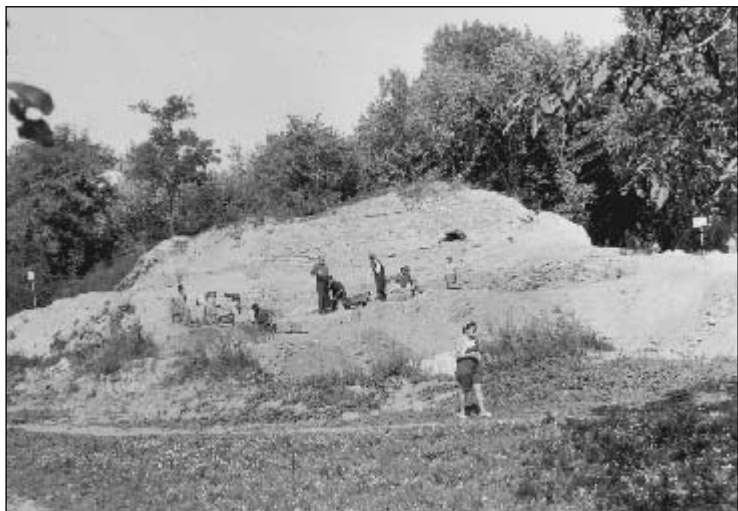
Az 1960-as ásátások kezdetei

Magdolna-templom alatt van. A Duna mai főága csaknem egy kilométerre folyik, Oroszvár északkeleti részét az ún. oroszvári kanális fogja körül. Az Oroszvár egyes részein lévő természetes mélyedések, amelyek a mai felszíntől kb. 3 m mélyen húzódnak, arról tanúskodnak, hogy az egyik folyóág egykor közvetlenül Oroszváron folyt keresztül. Lehetséges, hogy a Gerulata közelében gázló is volt a Dunán, de ez máig sem bizonyított.