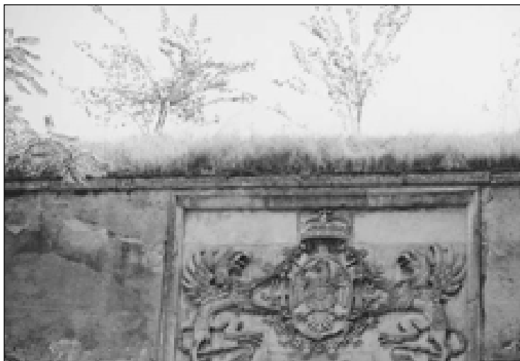
A 2. és 4. századból származó alapkövek

limes romanus. A limest a légiósok táborai (castrum legionis) és a kiegészítő egységek táborai (castellum) alkották. A légiós tábor nagyobb volt, körülbelül 6000 férfi számára készült, és csak római polgárok alkották. A kiegészítő egységek táborai kisebbek voltak, és itt a leigázott törzsek tagjai szolgáltak (500-1000 férfi). A védelmi vonalat kis őrtornyok - burgusok egészítették ki.