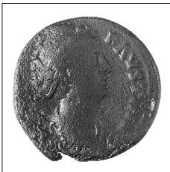
Marcus Aurelius feleségét ábrázoló pénzérme

A legrégebbi tábor Bergl térségében a Flavius nemzetség idejében keletkezett i.sz. 1. század második felében. Kettős árok és valószínűleg cölöpsor is övezte. Az árok északnyugati folyamatát közvetlenül Berglben fedezték fel, a délkeletit csak 1998-ban vizsgálták meg a Magyar utcában.