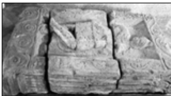
Nagyobb sírkövek maradványai