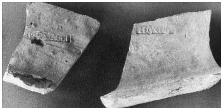
A X. és XIV. légió téglái

Úgy hisszük, hogy a castellum fiatalabb átépített részeinek délkeleti és részben északkeleti részei is a Duna áradása során pusztultak el. A kerületén körbefutó árok délkeleti részét a mai napig nem tárták fel. A tábor belső építményei közül a kaszárnyaépületeket és a kemencéket tárták fel. Az építmények Trajánusz császár uralkodása idején semmisültek meg. A tábor létrehozói a II-es temetkezési helyen nyugszanak. Nem ismerjük a legrégebbi tábort felépítő katonai egységet. A téglaleletek alapján alighanem az V cohors (cohors V Lucensium Callaecorum) vagy a XV Apollinaris légió volt itt, amely 118-119-ben végleg távozott Kappadokiába.