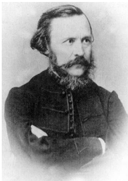
7. ábra Báró Eötvös József (1813-1871)

A magyarországi iskolahálózat iskolarendszerré alakítását a Mária Terézia uralkodásának ideje alatt megszülető első átfogó oktatásügyi rendelkezés – az 1777-es Ratio Educationis – megalkotói kísérelték meg elsőként. Hogyan jöhet létre iskolák szerteágazó hálózatából egy központilag átlátható és irányítható oktatási rendszer? Egymásra épülő iskolafokok létrehozásával, egységesen érvényesíthető központi követelményekkel, tantervekkel, állami segélyekkel, tanfelügyeleti rendszer kiépítésével és egy olyan szakmai réteg felnövekedésével és megerősödésével, amelynek képviselői magukra tudják vállalni az iskolázás gyakorlati feladatait, azaz egy professzionális pedagógus réteg megjelenésével. A Ratio Educationis, amelyet számos, a magyar iskolaügy fejlesztését érintő rendelet követett, megtette mindehhez az első lépést. A tankötelezettség bevezetése és egyben a magyarországi iskolahálózat polgári jellegű átalakítása, a modern közoktatás kiépítése azonban, az 1868. évi 38. tc. megalkotója, báró Eötvös József (7. ábra) nevéhez fűződik.