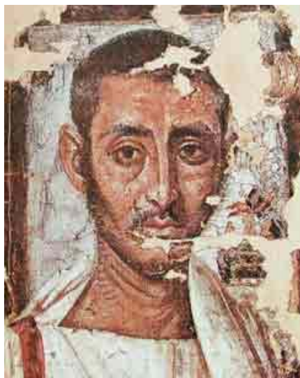
1. ábra Szent Ágoston (354-430)

számára elfogadott és nyilvánvaló alternatívát jelentett a gyermekeik kolostorba küldése. De mi a helyzet a törvénytelenekkel? A középkori keresztény vallási dogmák egyik – a gyermekkortörténet szempontjából kiemelt jelentőségű – példája az eredendő bűn átörökítésének kérdése, amely dogmát Szent Ágoston (1. ábra), a 4. század végén és az 5. század elején élt egyházatya nevéhez kötik. Eszerint a gyermek teste születésekor ártatlan ugyan, de a lelke az első emberpár bűnének nyomait viseli. Ennek következtében, ha nem neveljük a jóra, úgy a rossz tulajdonságai, az önzés, az akaratosság, az agresszivitás kerekednek majd felül. Ez minden gyermekre érvényes volt tehát a korabeli hivatalos vélekedés szerint. A törvénytelen gyermeket ebben az összefüggésben azonban nem csupán az eredendő bűn, de saját szülei vétkes magatartása is sújtotta. A társadalom tehát úgy vélte, hogy e súlyos lelki tehertől legkönnyebben a kolostorok megszentelt környezetében, a szigorú vallásos nevelés színhelyén lehet megszabadulni. A domonkos rend szerzetesei azonban egy másik szempontot érvényesítettek: úgy vélték a bűn, amivel az ilyen gyermek a világra jön, túlságosan nagy kockázatot jelenthet a szerzetes testvérekre nézve, ezért nem fogadtak be törvényteleneket. A világtól nagyrészt elzárt szerzetesi élet kívánatos volt a fattyú gyermekek számára a társadalom szemében, de a világi szolgálatnak már megvolt a maga kockázata, ezért kellett hozzá püspöki vagy pápai külön engedély.