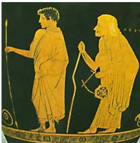
5. ábra Paidagogos, fiúkísérő, I.e.V.sz. Athén

annak a rabszolgának a megnevezése volt, aki a fiúgyermeket az iskolába elkísérte (paidagogosz – fiúkísérő). (Mészáros, 1982) (5. ábra)