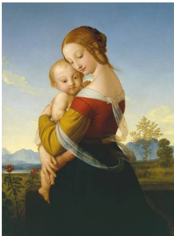
2. ábra William Dyce: Madonna gyermekével, 1827-30

valami jobb, ideálisabb felé. Ennek a változásnak az alapja az emberek közötti – elsősorban a gyermek és az anya közötti - pszichés kapcsolat változása (2.ábra).