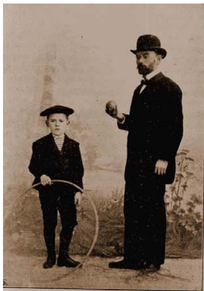
8. ábra 1901. Néptanító kisfiúval

Ez harmonizál a 19. század végi, 20. század eleji nemzetközi törekvésekkel, az iskolai nevelés reformját célzó kezdeményezésekkel, amelynek háttérében egy szélesebb társadalomkritikai alapra épülő komplex eszmerendszer, az életreform mozgalom áll.