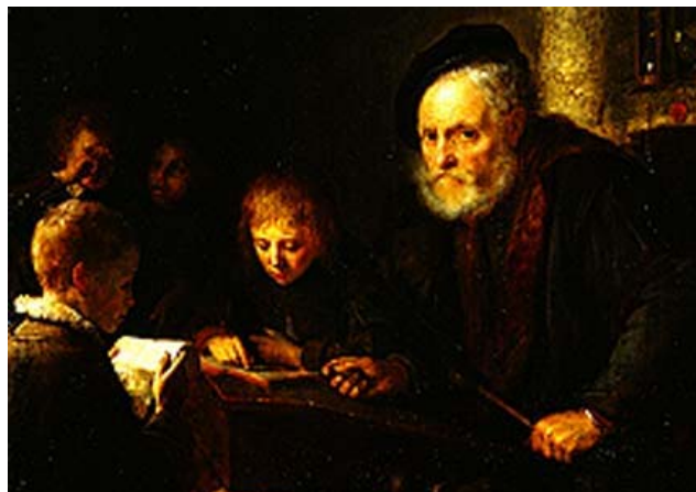
4. ábra Gerrit Dou: Iskolamester

Érdemes megjegyezni, hogy ezzel a „negatív” gyermekképpel párhuzamosan tartotta magát egy másik, ennek éppen ellentmondó vélekedés a gyermeki ártatlanságról is, amelyre megint csak találunk bibliai utalást: „És monda: Bizony mondom néktek, ha meg nem tértek és olyanok nem lesztek mint a kis gyermekek, semmiképen nem mentek be a mennyeknek országába.” 3 (Golnhofer, Szabolcs, 2005)