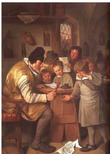
3. ábra Jan Steen: Iskolamester

megszégyeníti az ő anyját.” 2 Ennek alapján tehát, aki gyermekét megveri, segít neki abban, hogy lelke felszabaduljon a gonosz hatalma alól. A reformáció nyomán létrejövő protestáns egyházak megerősítették ezt az elvet és továbbvitték a gyakorlatot. Az ágostoni elmélethez kapcsolódó negatív gyermekkép átörökítéséhez tehát – elsősorban Luther tanítása alapján – a megreformált egyházak is hozzájárultak. Ez ellen, a gyakorlatból kivészni nem akaró, egyébként már az ókortól fennálló jelenség ellen, a legtöbb pedagógiai elméletalkotó felemelte a szavát, kezdve Quintilianus, antik római rétortól egészen napjainkig.