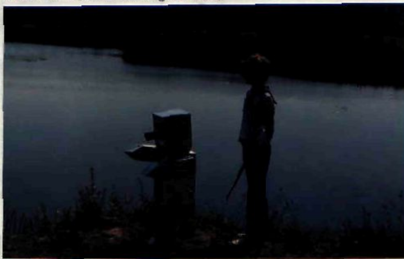
Elöl ment Robóm és mögöttem én.

Egy valami mégis csak feltűnt ! Nem láttam a Hold tükörképét a víz felszínén. De vizet láttam az biztos ! Közben már nagyon sötét lett, így meggyorsítottuk lépteinket. Elöl ment Robóm és mögöttem én.