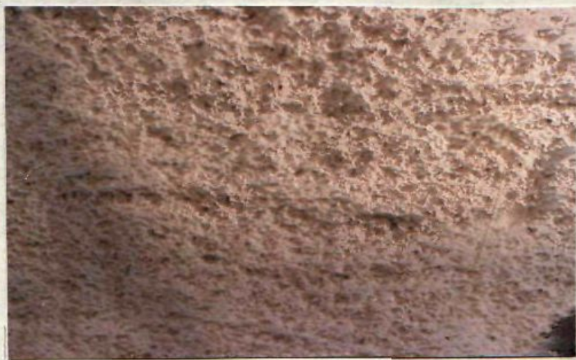
Az egész völgykatlant fehér "embercsíra porral" szórtuk be.

Mivel mi nem adunk életjelt magunkról, a határidő pedig lejár, ezért megfognak támadni bennünket illetve a hologram képeinket. Ismerjük támadási módszerüket. Egymással összefonódva óriási parabolatükröket alakítanak ki a világűrben. Azok segítségével összegyűjtik a világegyetemben levő mindenféle sugárzást, hullámot, részecskéket és azokat koncentráltan a célpont-ra irányítják. A koncentrált fény, hő, rádióaktív és neutrínó sugár igen nagy átütőképességű és az antigravitációs védőpajzsunk sem tud ellenállni. Hatására atomvillanások jönnek létre, ami mindent elpusztít. Ezt a pillanatot kell kihasználni, hogy mindenki a saját bolygójára tudjon repülni. A fény-lények így azt gondolják, hogy mindent elpusztítottak és távoznak a Földről. A Föld túlsó oldalán robotaink már régebben elkezdtek dolgozni. Ezt te is tudod. Azon a részen találtunk egy óriási kiterjedésű völgykatlant. Az egész völgykatlant fehér "embercsíra porral" szórtunk be. Legnagyobb részben már el is ültettük a műanyag tápcsövekbe helyezett "embercsírákat". Azok figyelembe véve az újabb atomvillanások hatását, száz év múlva kerülnek olyan stádiumba, hogy "emberi ént" lehet beléjük ültetni. Mivel emberi lény, csak Te vagy egyedül Prága Kislányom, ezért száz évig meg kell őriznünk.