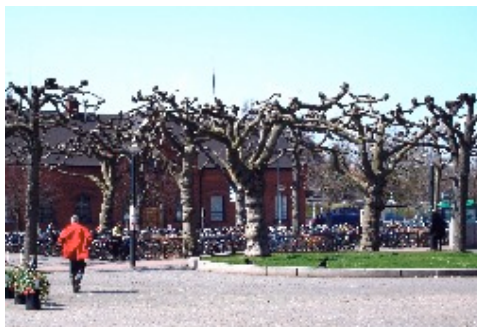
Csonkig lombtalan fák a svédországi Lundban

Magyarország magyarság nélkül?! „Az nem lehet...” Ez nem lehet! De van, és mindig is lesz magyarság – „ahogy lehet” – anyaország nélkül?! A nem-re, most sem lehet más, nincs sajtóbb, magyarabb felelet!