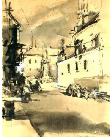
Óvárba születtem – Deák Ferenc grafikusművész aláíratlan rajza