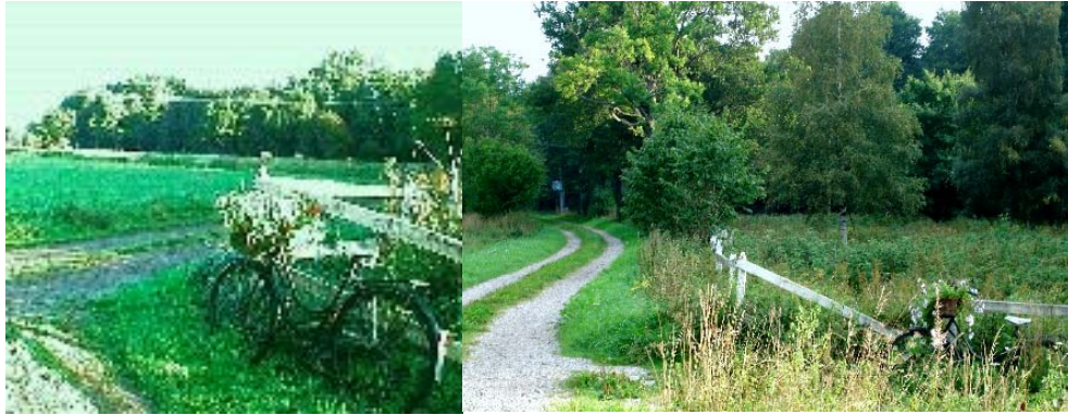
Az elhagyott kerékpár története