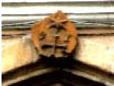
A kolozsvári Bel-Magyar utca Vesselényi-háza kapujának záróköve S(igismund) T(ar) feltételezett címerével

mióta lélegzem sietős az utam tiltások vörös lámpája alatt állok a velünk törtétek mögött gombnyomásos indulattal és időtlenné faragom minden pillanatom