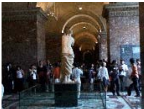
A hátát mutató Vénus