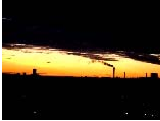
Szorítóban a fény