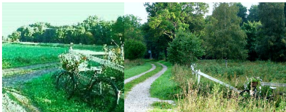
Az elhagyott kerékpár története