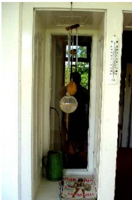
Ház, ahol befogadtak