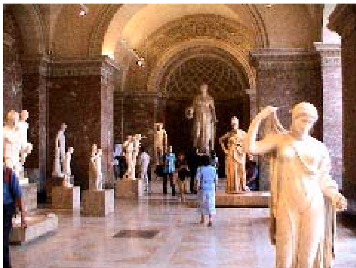
Séta európai levegőben