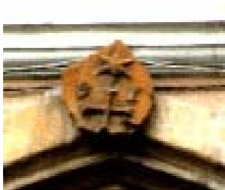
A kolozsvári Bel-Magyar utca Vesselényi-háza kapujának záróköve S(igismund) T(ar) feltételezett címerével

mióta lélegzem sietős az utam tiltások vörös lámpája alatt állok a velünk történetek mögött gombnyomásos indulattal és időtlenné faragom minden pillanatom