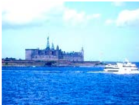
Hamleti sugallat: Lenni

napfűtő szeretnék lenni kozmoszban forgalomirányító valamiféle tündérkirály, esetleg maga a magasságos – na nem az a földre töpörített – leginkább az egyetemes az a nagyságos és méltóságos legeslegképzeletbelink aki vagyok még szűkre szabottan: örökké elégedetlen a tökéletlen emberi létben