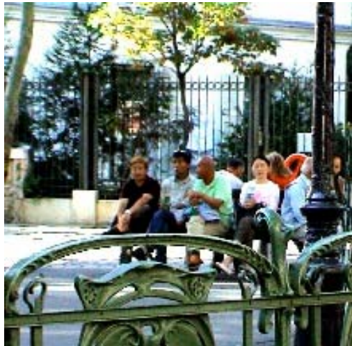
A soknemzetiségű Párizs

Szól a mantra, szól a mantra, szó zörög Szól a mantra, szól és újra felpörög Hare krisna, hare krisna, krisna, krisna Hare hare krisna hare, hare krisna Zúg a mantra, szól a mantra, szó hörög Szól a mantra, zúg a mantra, szól a hanta Az értelmetlen és lepergő lét fölött.