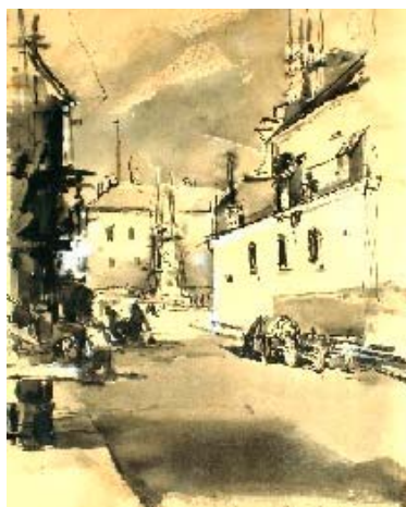
Óvárba születtem – Deák Ferenc grafikusművész aláíratlan rajza