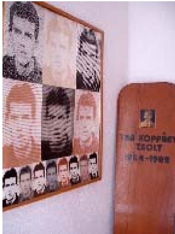
Az Ismert katona fejfája