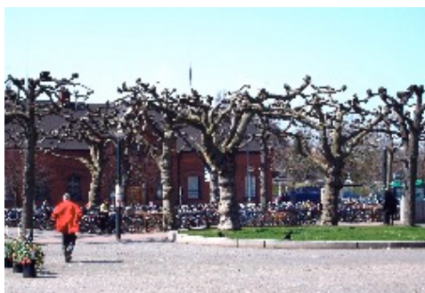
Csonkig lombtalan fák a svédországi Lundban

Magyarország magyarság nélkül?! „Az nem lehet...” Ez nem lehet! De van, és mindig is lesz magyarság – „ahogy lehet” – anyaország nélkül?! A nem-re, most sem lehet más, nincs sajtóbb, magyarabb felelet!