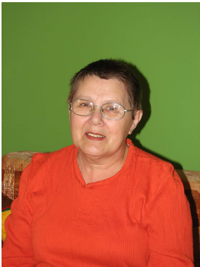
A kötet szerzője