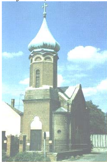
Egykori Szerb templom, jelenleg kiállítóterem