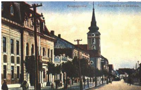
Városháza – Római kat. templom (korabeli kép)