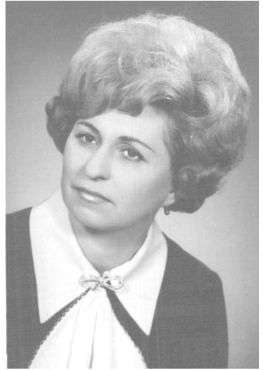
A kötet szerzője (1968)