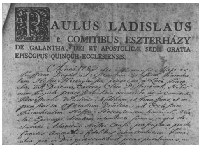
Az 1783-as Eszterházy-féle Visitatio Canonica első bekezdése