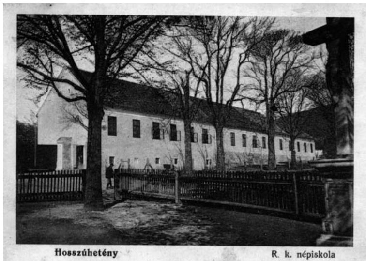
Az iskola a II. világháború előtt

A „fordulat évében” Hosszúhetényben is történtek kirívó esetek: „[1948] július elején három bányászlegény részegen bejött a plébánia folyosójára és kijelentették, hogy ezután ők parancsolnak az iskolában, papok többé nem léphetnek be az iskolába [az iskolát 1948. június 16-án államosították].” 33 ; „Szeptember 5.-én felolvastuk a püspöki