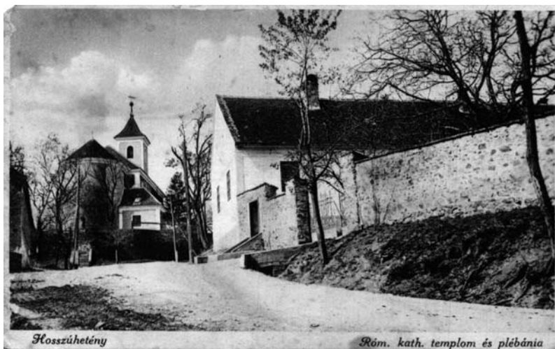
Egykorú képeslap a plébániáról és a templomról (az 1900-as évek eleje)