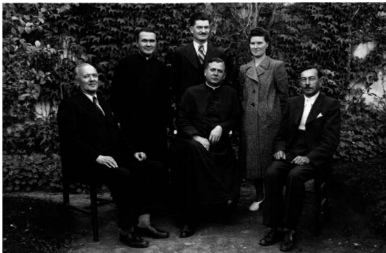
Csoportkép az 1940-es évekből.

hívó lélek bölcsességével tudott mindenkor megnyugodni az Isten akaratán. Nemcsak családjának, de az egész községnek példaképül szolgál minden időben hitvalló, katolikus életével.” 30