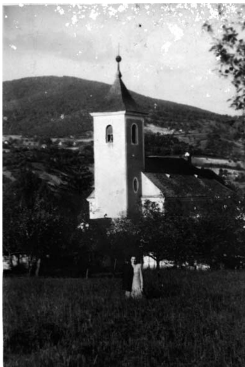
A hetényi templom az 1900-as évek elején