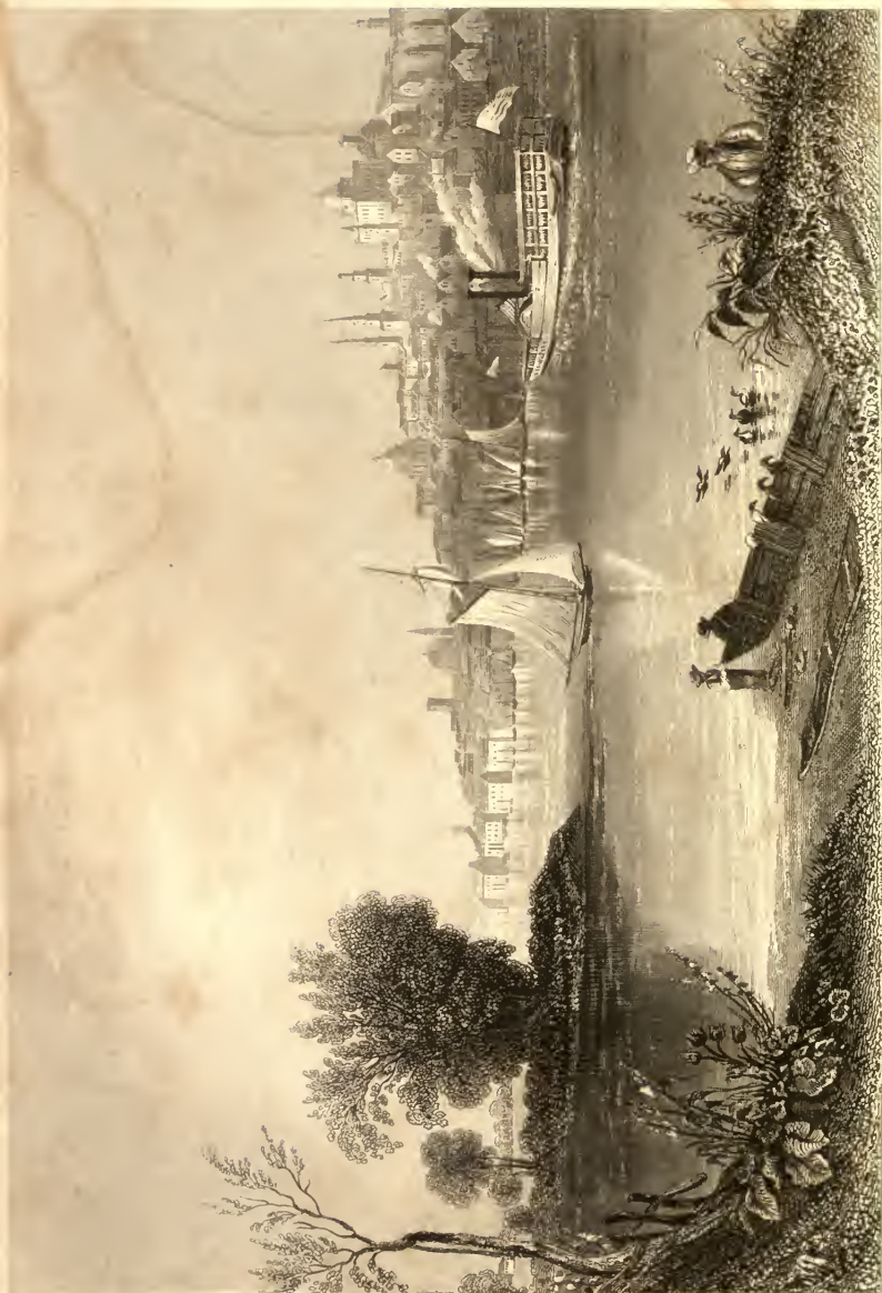
View of the City of Annapolis