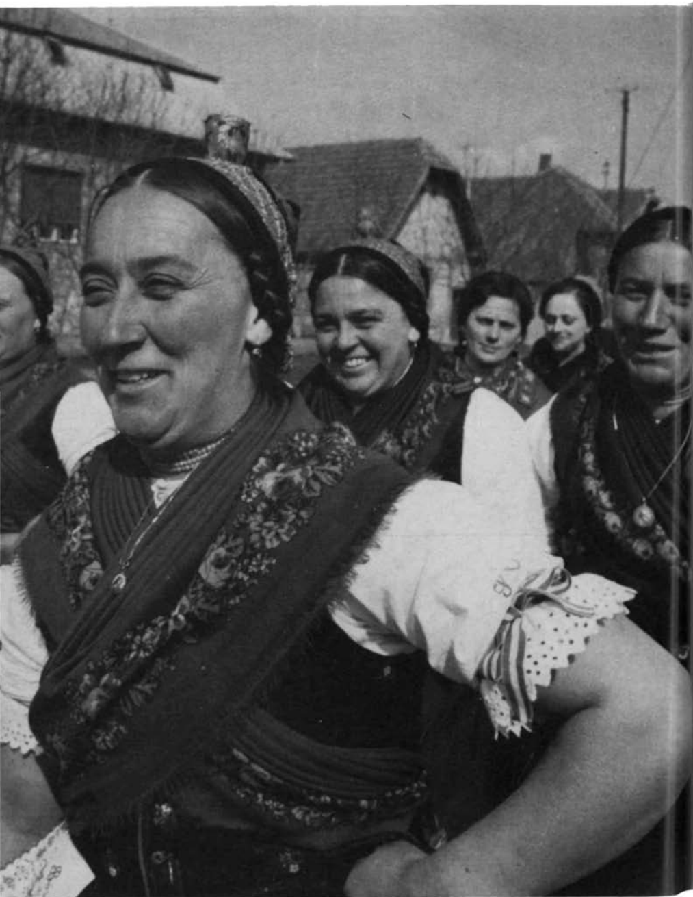
GALGAMENTI FESZTIVÁL, 1975