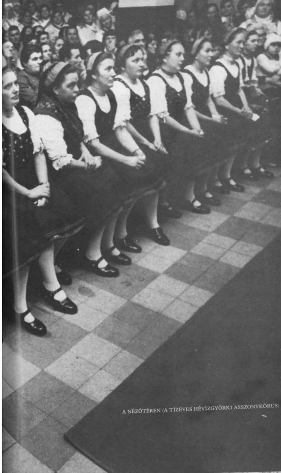
A NÉZŐTÉREN (A TÍZÉVES HÉVÍZGYÖRKI ASSZONYKÓRUS)