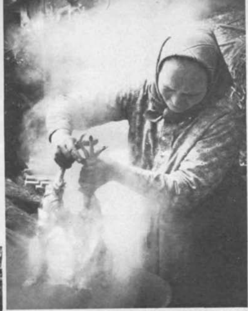
A TYÚKKOPASZTÁS - NŐI MUNKA