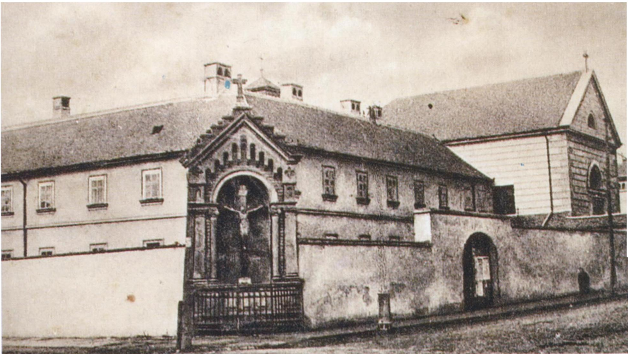
Az 1742-ben felépült rendház 1900 körül készült fényképe