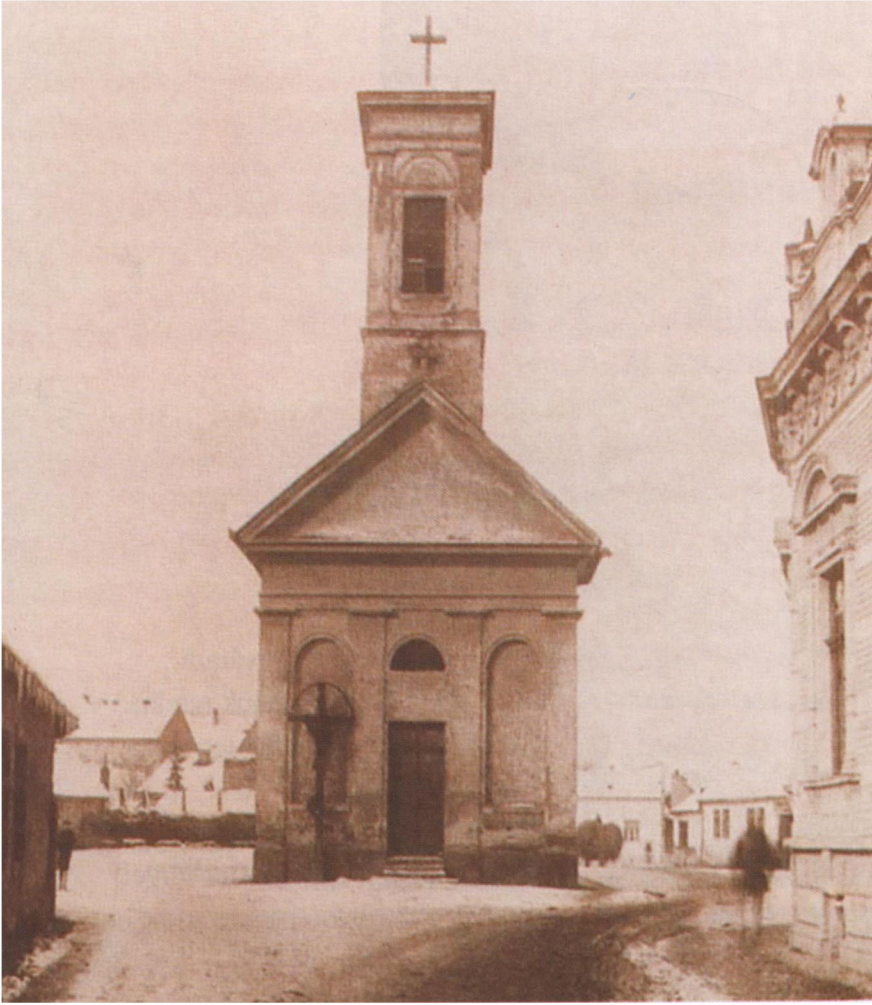
A kapucinusok első váradi temploma, az egykori temetőkápolna