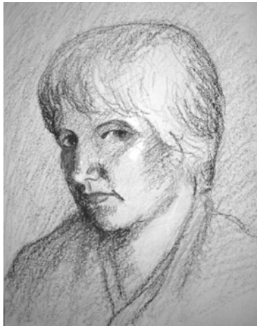
Régi önarckép kréta

Toporgok az útfélen, s alattomban úgy vélem, ha a madár földre száll, trágyadombon kapingál.