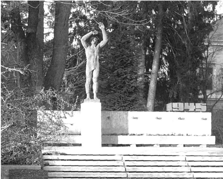
Emlékmű Letenyén. (Fotó)

Szobor a téren. Egy szegény paraszt. Szabadságot várt, békét és vigaszt. Karját a fényre tárja, vagy legyint? Múlnak az évek. Becsapják megint? Koszorúzták már balról, jobb-felől, már nincsen szónok, akinek bedől. Ki nincstelen, annak minden hiába, csak négyévenként veszik emberszámba. Gyűlhet köré szép ünneplő tömeg, ő csak legyint... Remélem értitek!