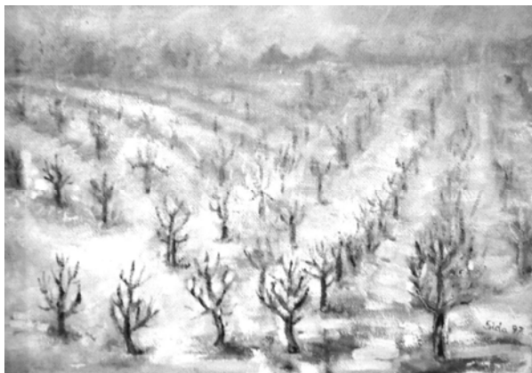
Téli gyümölcsös (olajfestmény)

A sebek végül mind beforrnak, talán még ma, talán majd holnap. Sebek nélkül könnyebb lehet elviselni az életet.