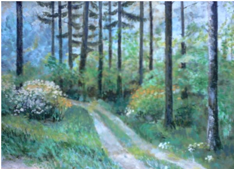
Budafai parkerdő (olajfestmény)