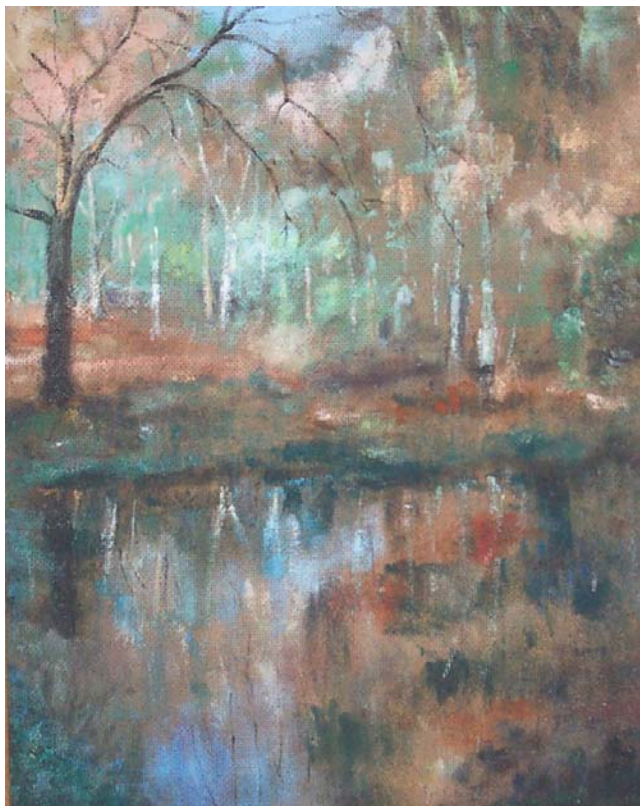
Budafa. Alsó tó (Olajfestmény)