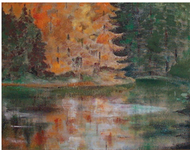
Felső tó Budafán (Olajfestmény)