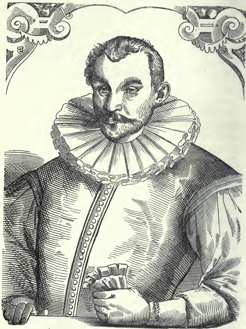
A Lugossy tanár úrnál lévő eredeti egykorú fametszet hasonmása.