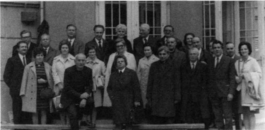
A 25 éves találkozásnk csoportképe, 1979.