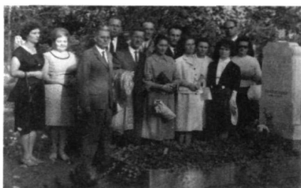
A 10 éves találkozókon a temetőben és a professzorok