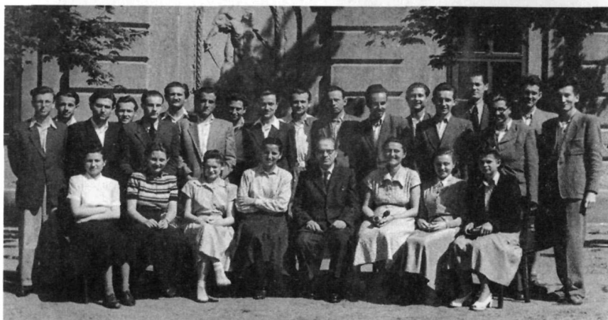
III. évesek voltunk, és alul a professzori kar vizsgáztatás közben