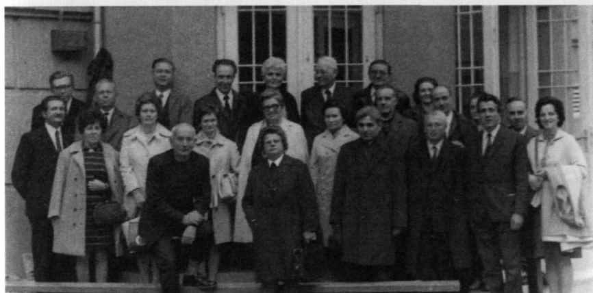
A 25 éves találkozásunk csoportképe, 1979.