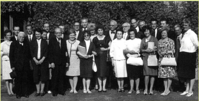
A 10 éves találkozásunk, 1964.