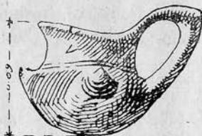
1. ábra. Trója VII. rétegében talált, Kárpátok-dunamenti edény. (Schmidt után Dörpfeld : Troja und Ilion . 594. és köv. ll.)

II. Valójában a magyarországi típusú fazekasipar — amelyet ama szarv alakú kidudorodások és rézsutosan kivágott edényperemek jellemeznek, amelyeket Hampel mutatott be a magyarországi bronzkor ismertetésében és amelyeket Schmidt , Götze után Reinecke segítségével a magyarországi bronzkor IV. szakaszába, tehát Reinecke szerint a Kr. előtti XII.—IX. századba helyez, 4 — régibb ennél az időnél. A bronzkor III. szakába tartozik s ezt egyik asszisztensem, Cristescu V. , Călăraşitól nyugatra, a Boian-tó szigetén határozottan a bronzkor IV. szakaszánál (ez egyébként nálunk megfelel a nyugati Hallstatt I. szakaszának) régebbre valló körülmények között találta meg. De egyébként is a Tisza felsőbb folyása mellől, Borsod megyé-