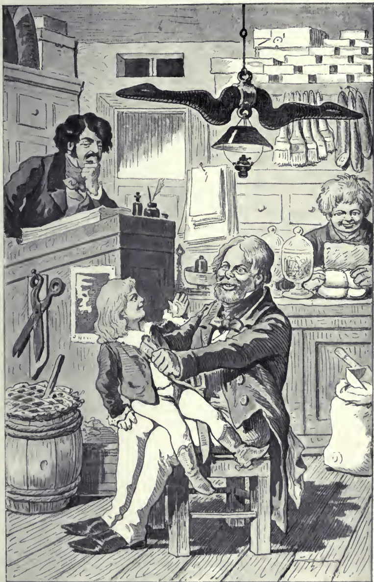
Az apa leült s a fiút két térdére ülteté