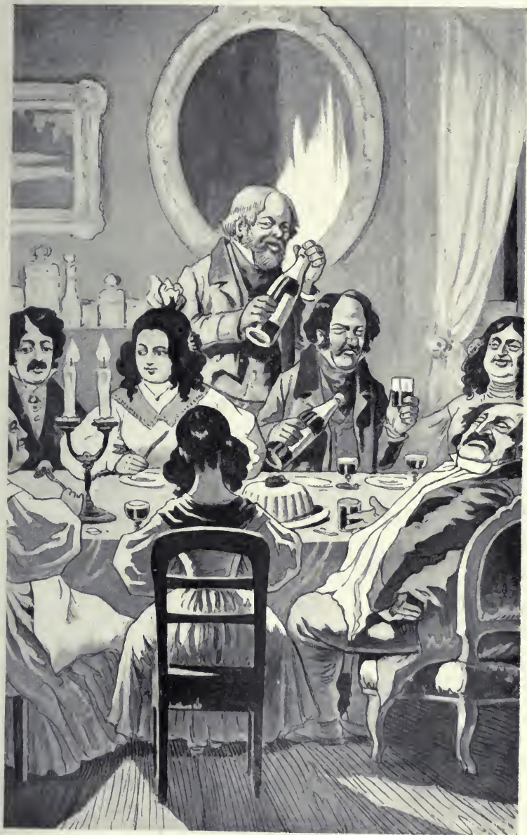
A jó Goldbach mindent elkövetett a társaság felvidámitására.