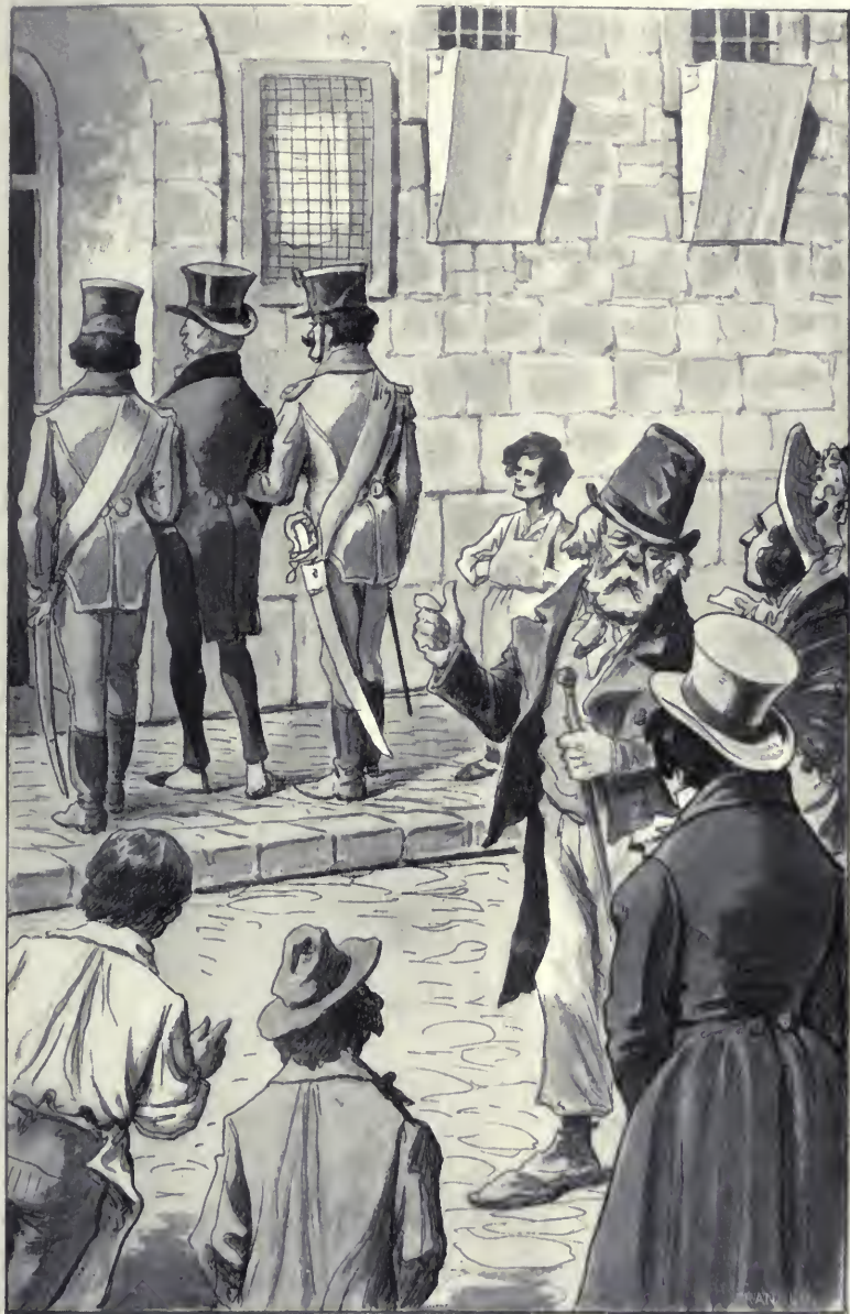
A tömeg közül, erős őrizet alatt, egy igen jól öltözött férfit kísé- lek be a börtönbe.