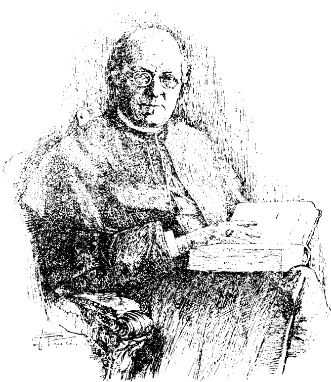
Székelyi Gróf Majláth Gusztáv Károly erdélyi püspök