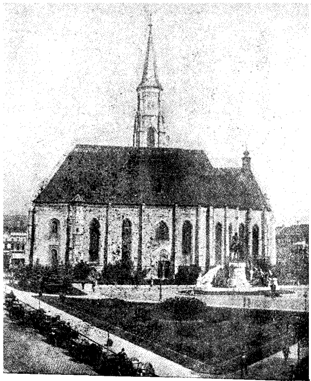
A kolozsvári Szent Mihály templom