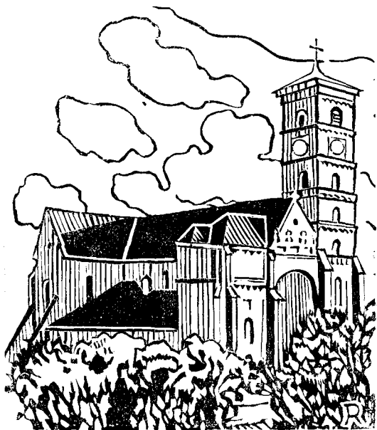
A gyulafehérvári székesegyház