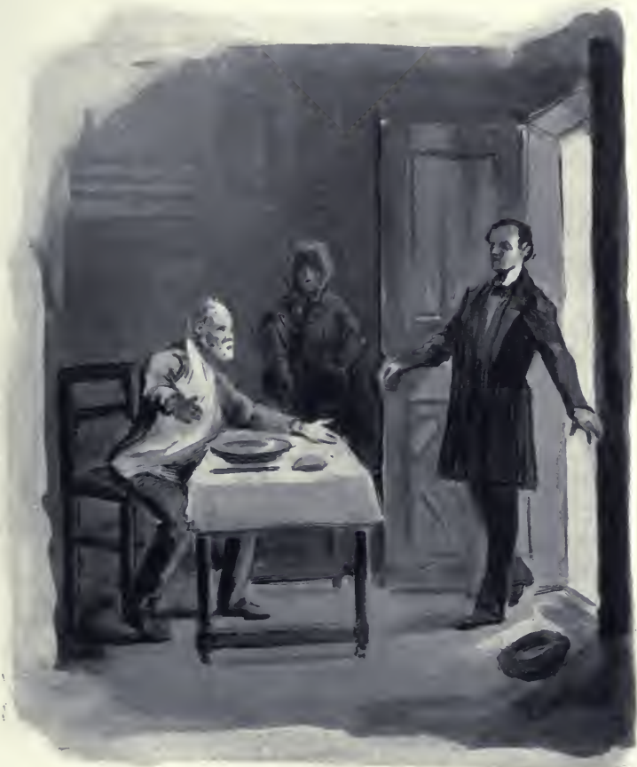
Kázmér karjait kitérta.