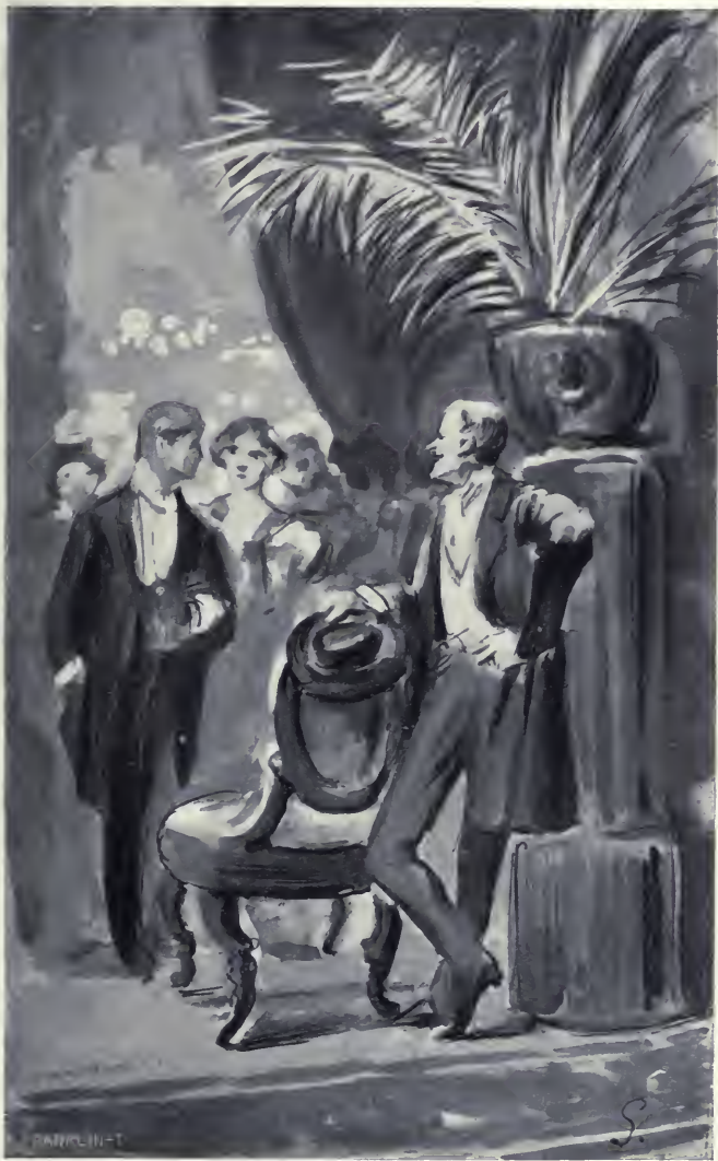
Verdesi nem közönséges alak.