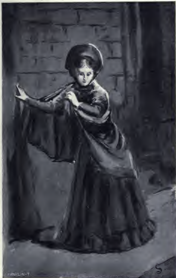
Falhoz, vagy kapuhoz dőlt.