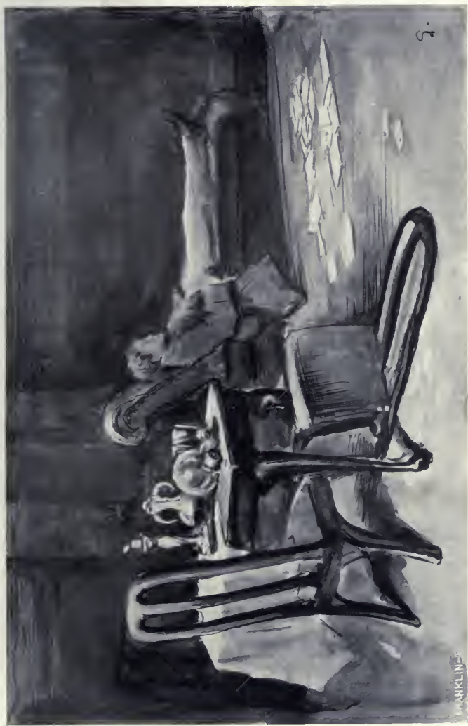
Ott látta kedves öcsjét pamlagán elterülőve.