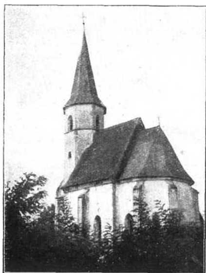
A szentbenedeki Kornis-kápolna. XVI. század eleje.