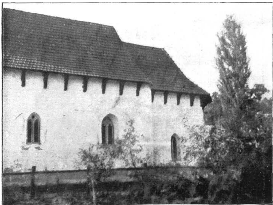
A noszolyi református templom. XIII–XIV. század.