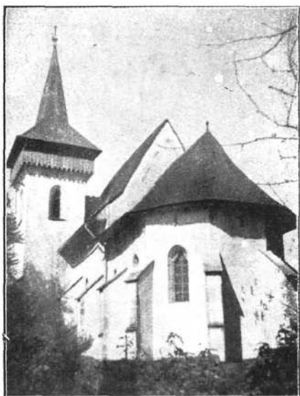
A somkeréki református templom. XV. század.