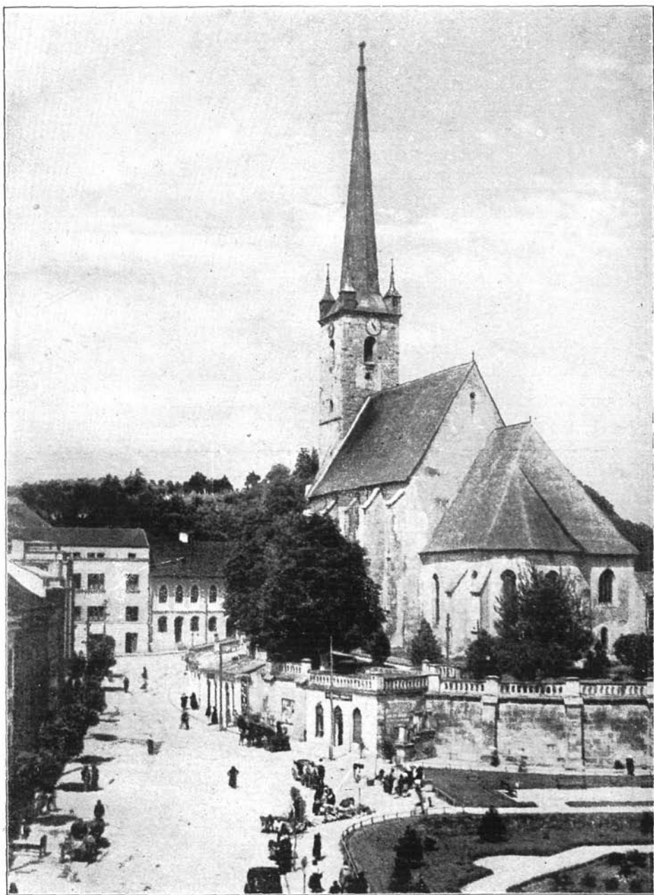
A templom mai képe délkelet felől.