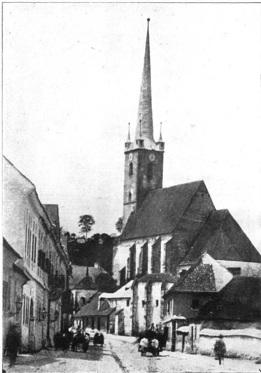
A dési református templom (XV. század vége).

A múlt század végi felvételen látszik a régi várfal egy részlete is.