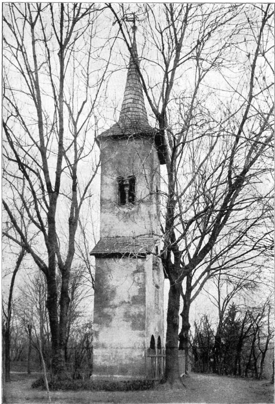
A dési óvári torony.

E műemléket 1938. november 8-án éjjel lerombolták; kővei megsemmisültek.