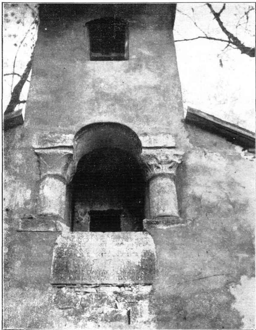
Az Óvári-torony középső része; az ablak-oszlopok XII. századiak.