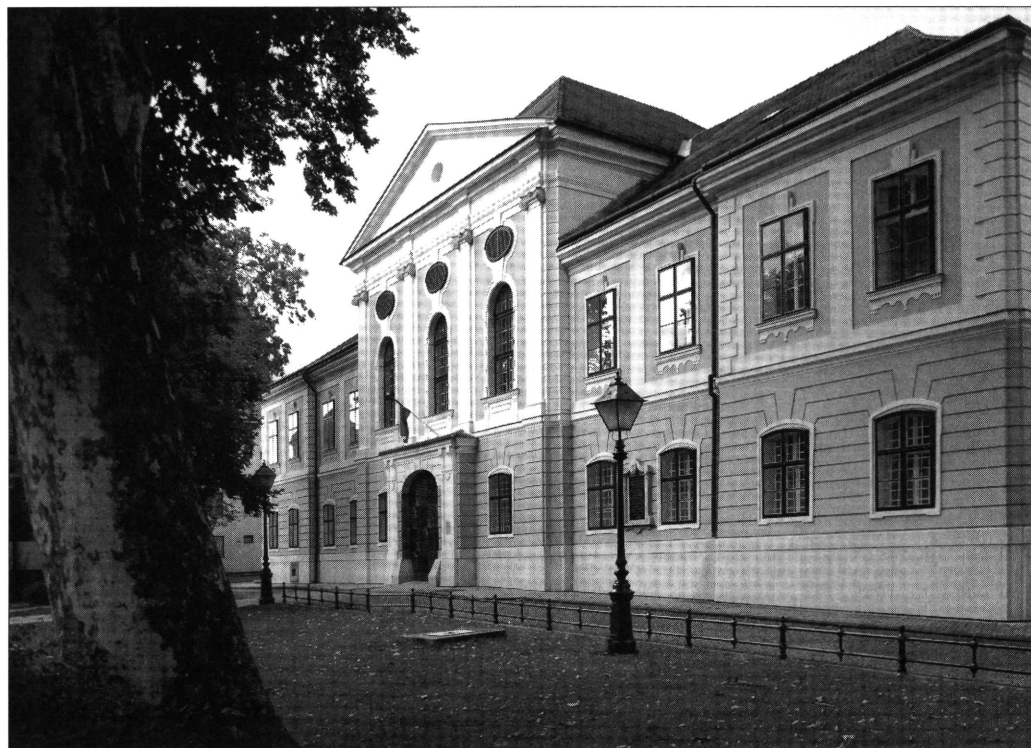
Az egykori vármegyeháza, ma a Zala Megyei Bíróság épülete