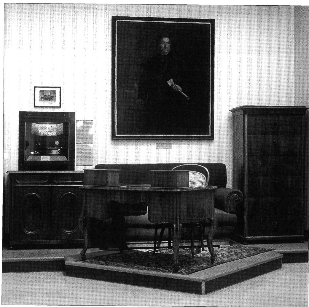
Deák Ferenc hagyatékának legjelentősebb darabjai a Magyar Nemzeti Múzeum állandó kiállításában