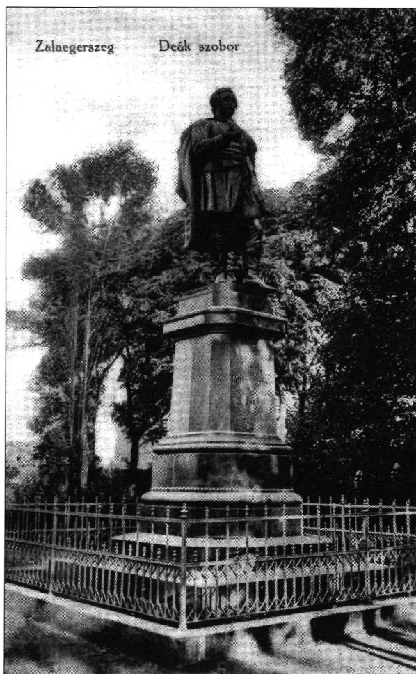
Deák Ferenc szobra Zalaegerszegen egy 1905 körül készült képeslapon Göcseji Múzeum