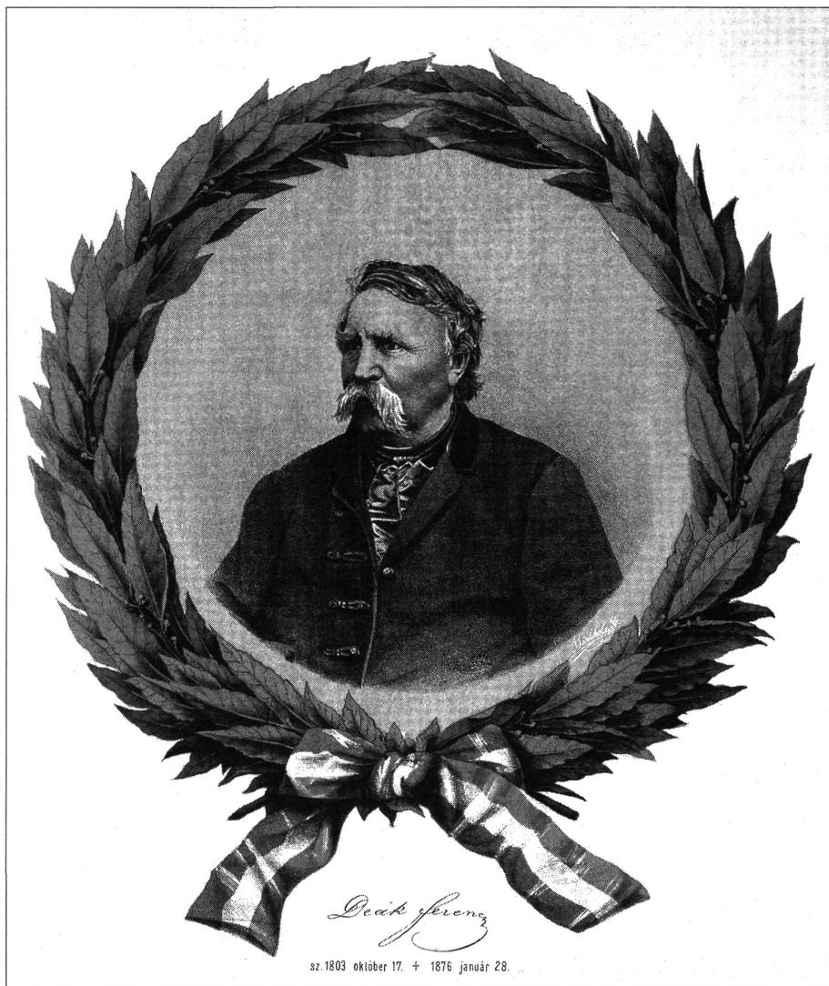
Deák Ferenc mellképe színezett litográfia Magyar Nemzeti Múzeum, Magyar Történelmi Képcsarnok