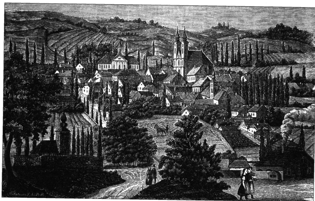
Zalaegerszeg látképe a 19.sz. közepén fametszet Magyar Nemzeti Múzeum, Magyar Történelmi Képcsarnok