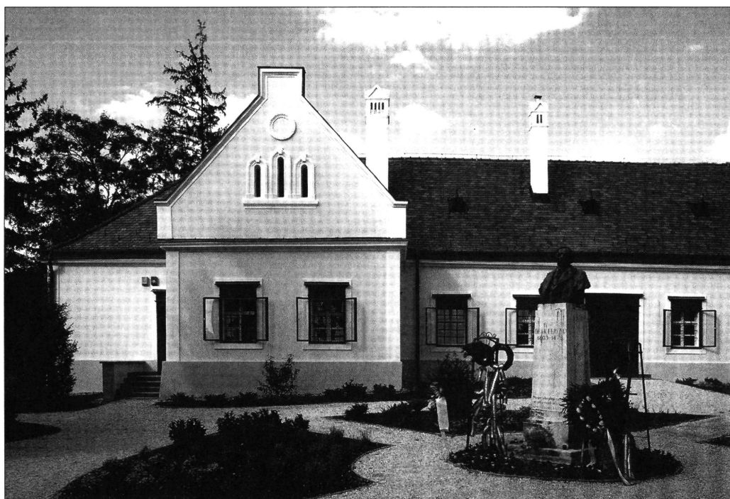
A 2003-ban felújított kehidai Deák-kúria