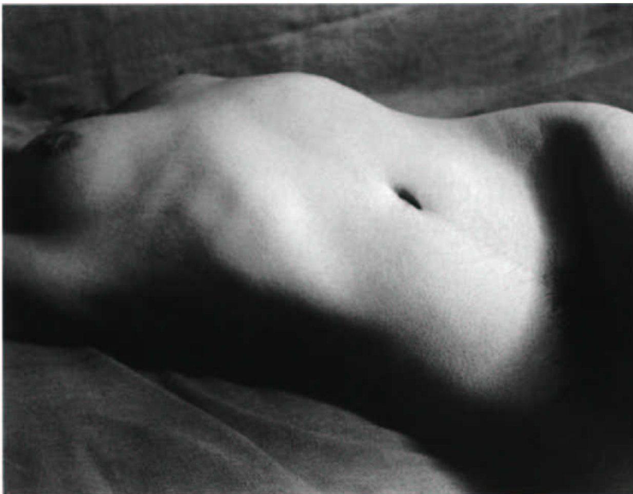
11. kép Brassai: Cím nélkül, 1933