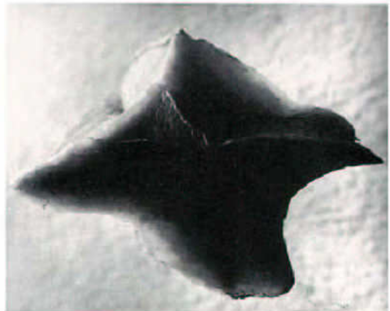
4. kép Brassai: Önkéntelen szobrok, 1933