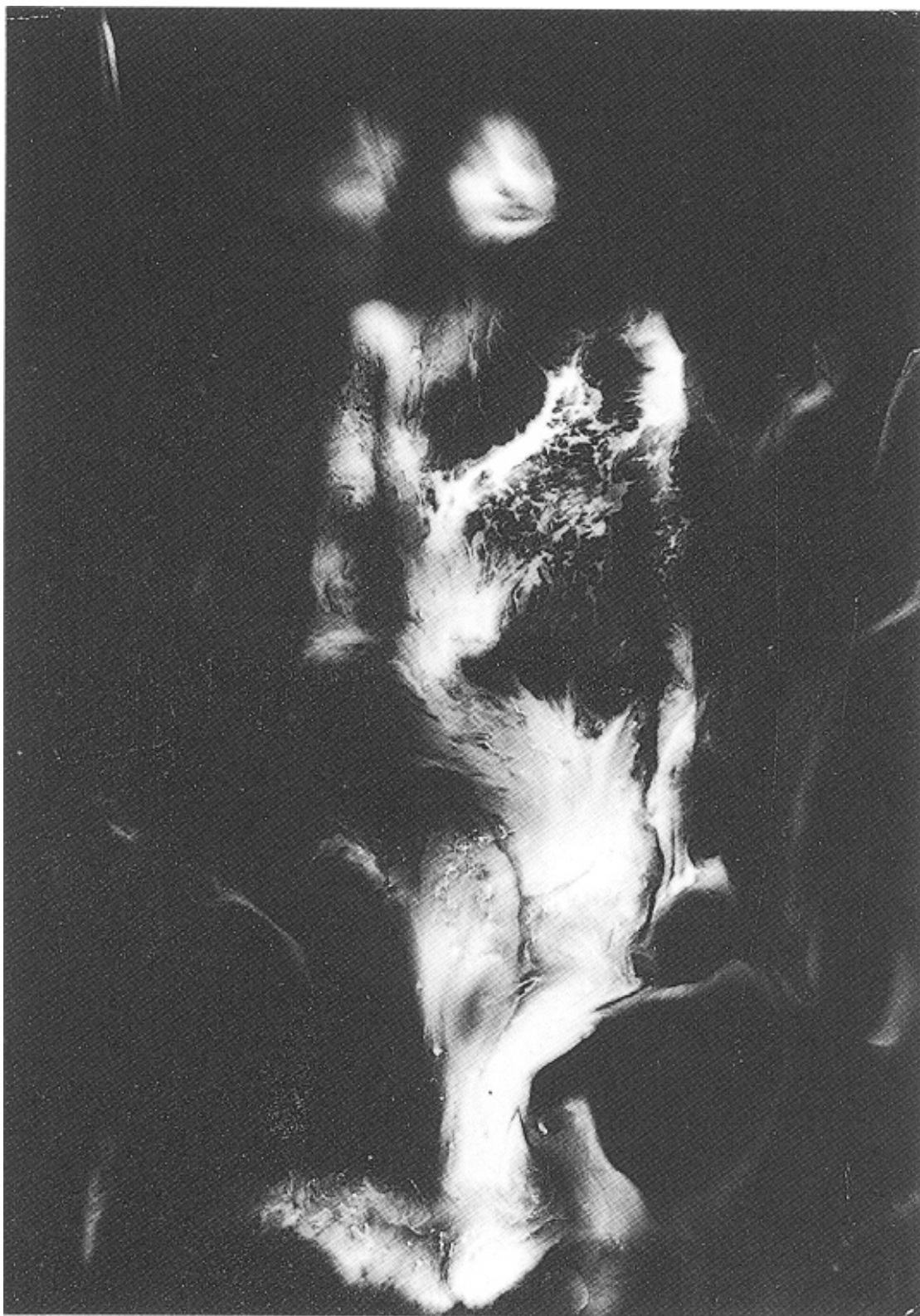
9. kép Raoul Ubac: Csillagköd, 1939