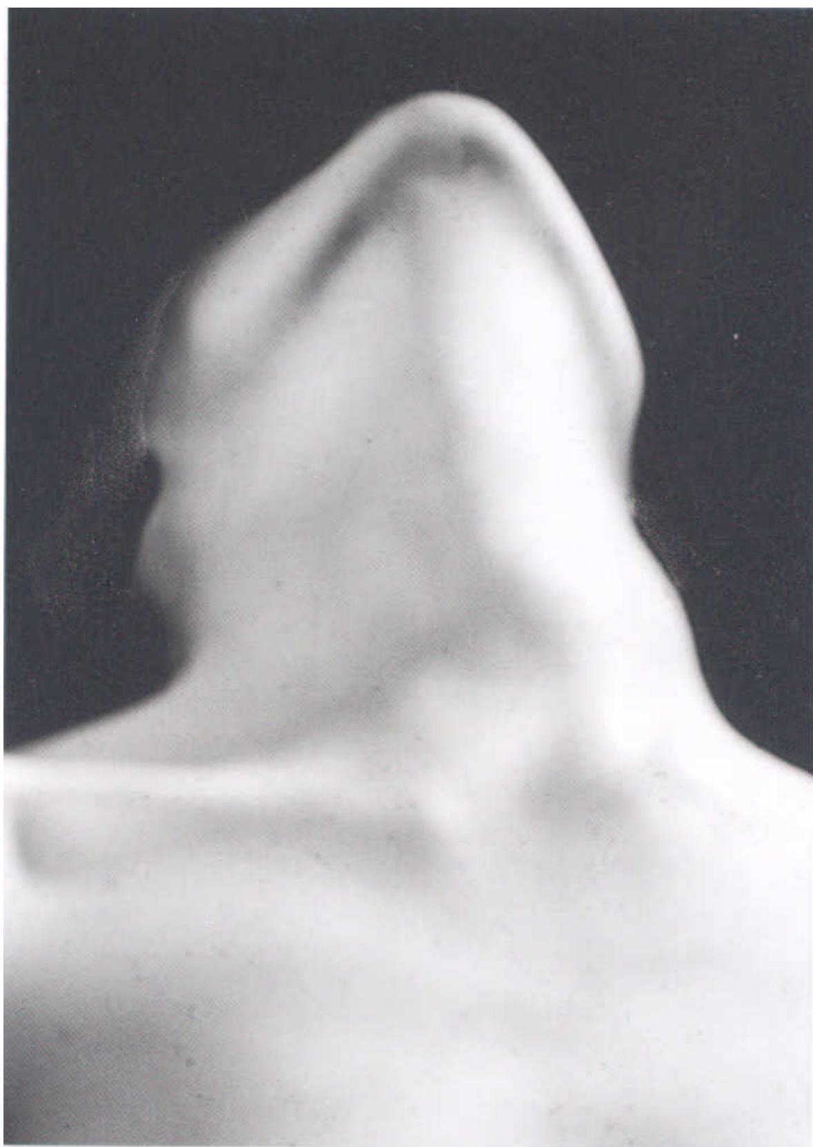
5. kép Man Ray: Anatómia, 1930