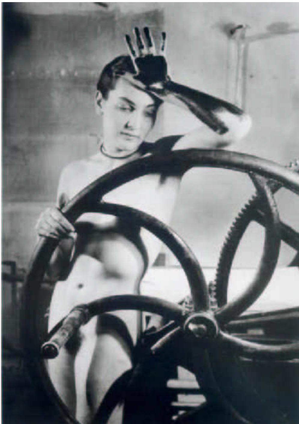
2. kép Man Ray: Rejtett-erotikus, 1934