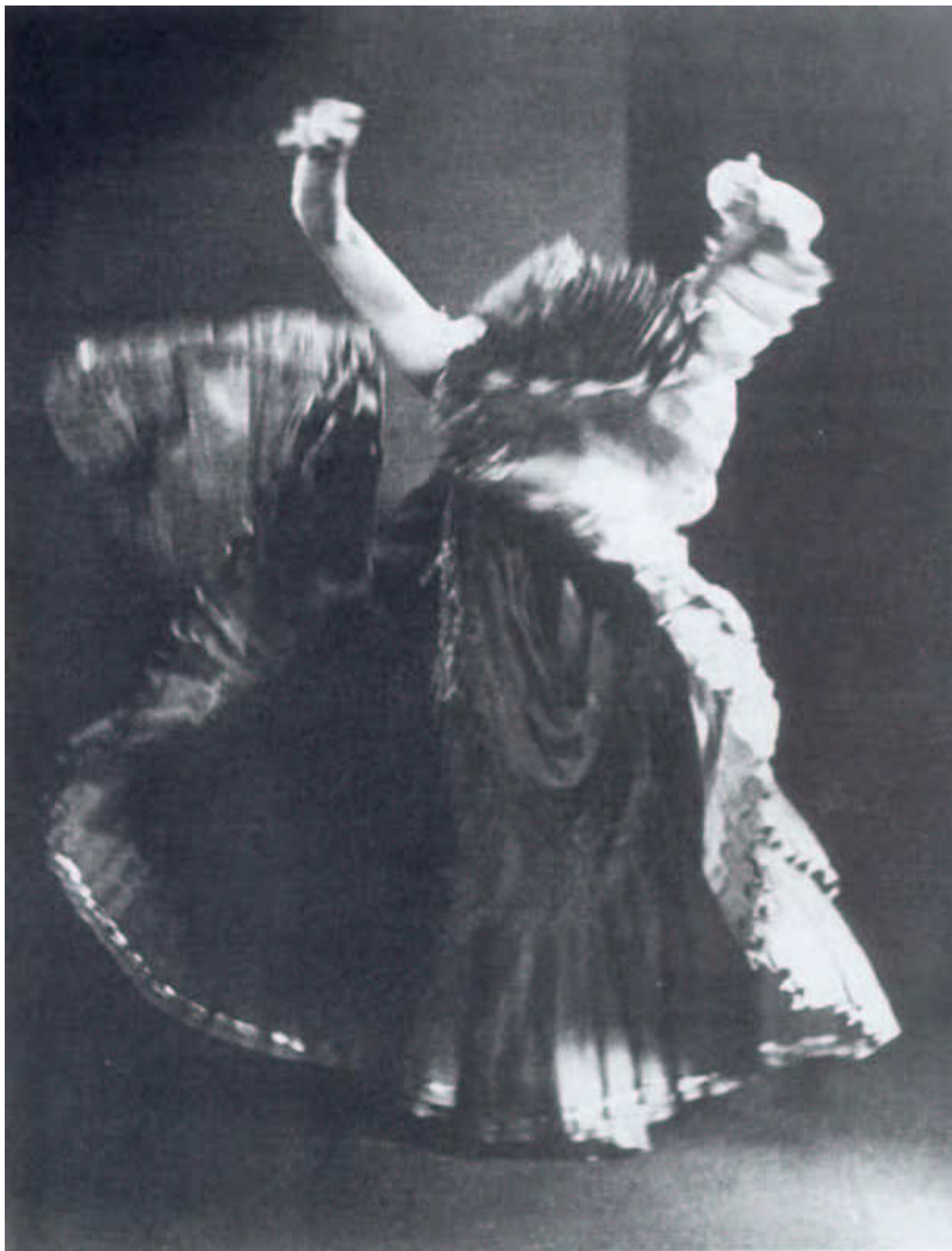
3. kép Man Ray: Robbanó-mozdulatlan, 1934