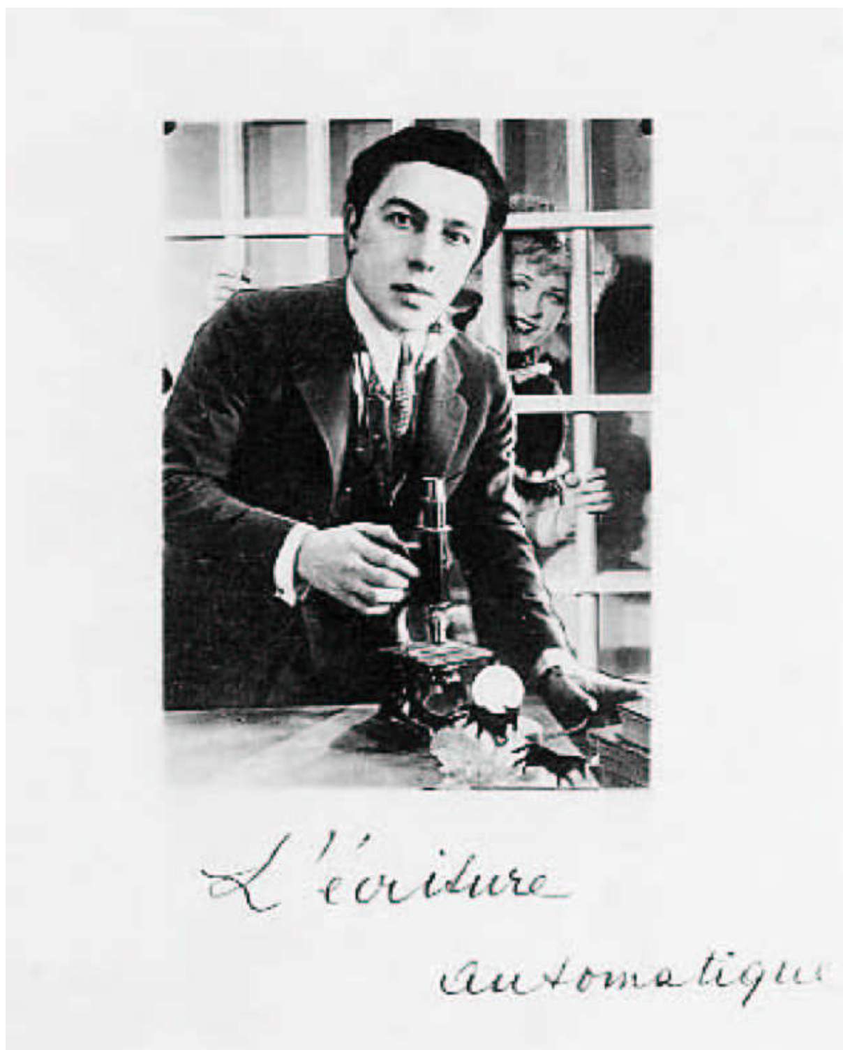
1. kép André Breton: Automatikus írás, 1938