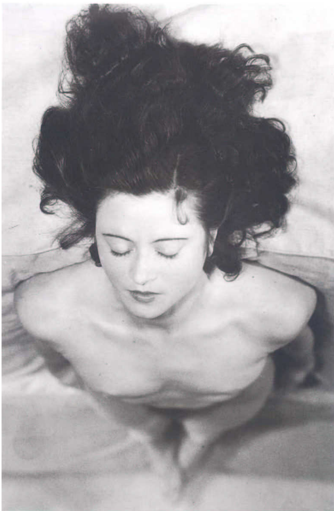
7. kép Jacques-André Boiffard: Cím nélkül, 1930