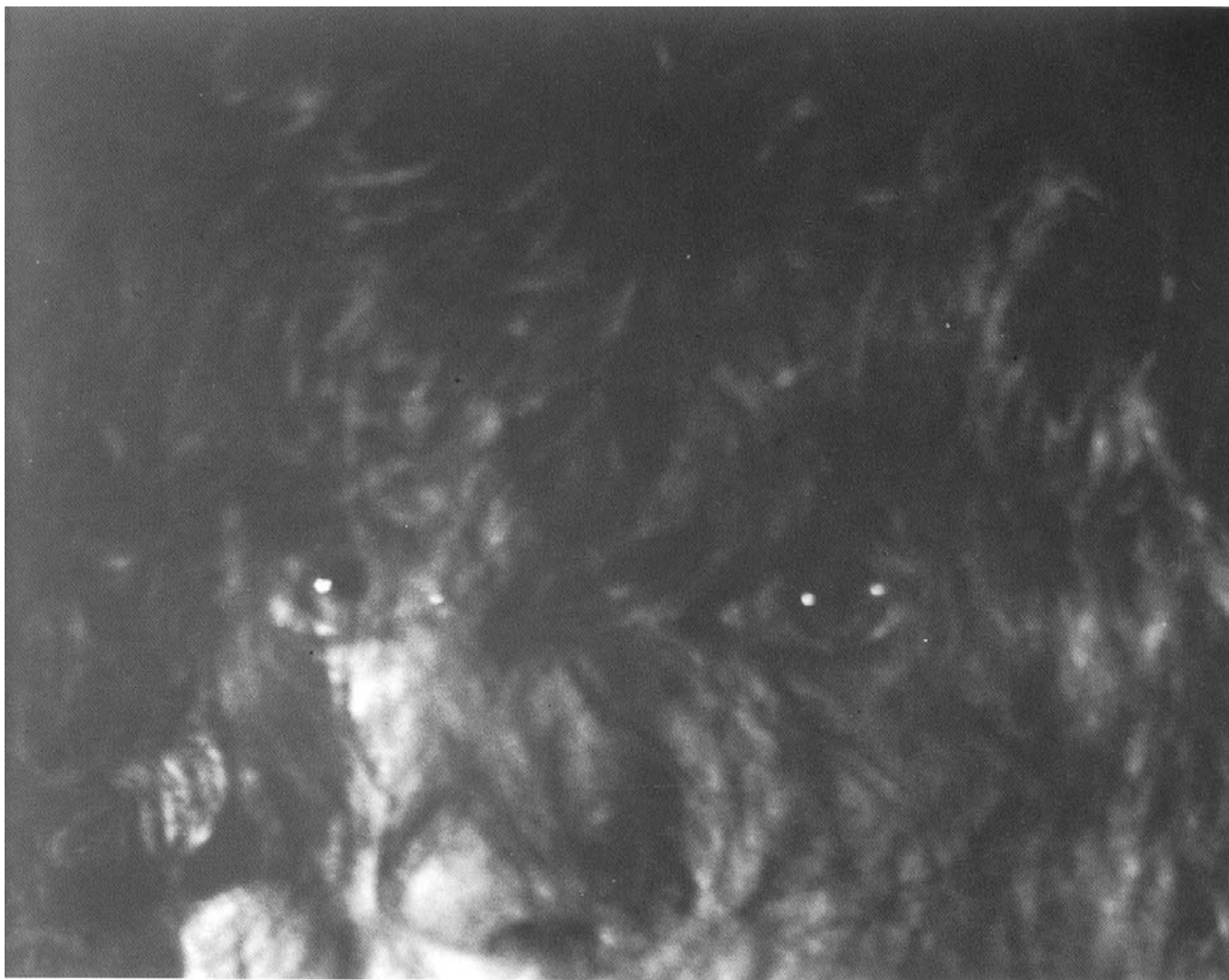
10. kép Jacques-André Boiffard: Cím nélkül, 1929