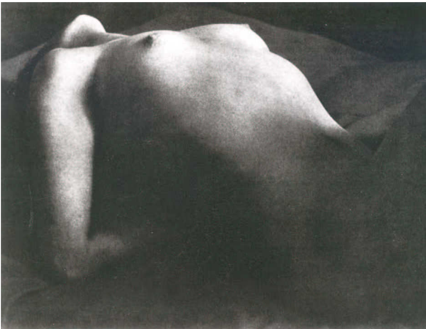
6. kép Brassai: Cím nélkül, 1933