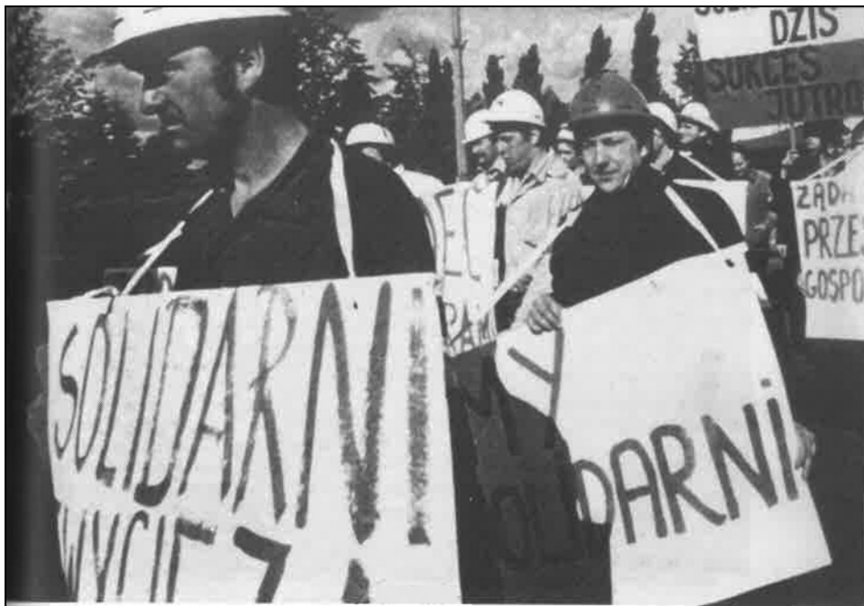
extrájkolók 1980-ban és 1988-ban