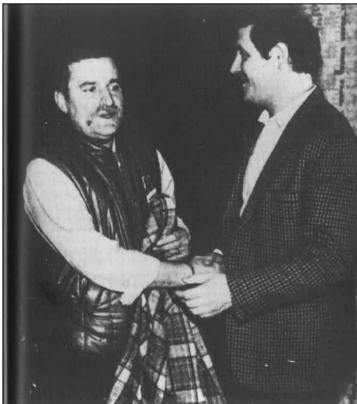
A betiltott Szolidaritás vezetői. Wałęsa üdvözli a 1986. évi amnesztiával szabadult Bujakot