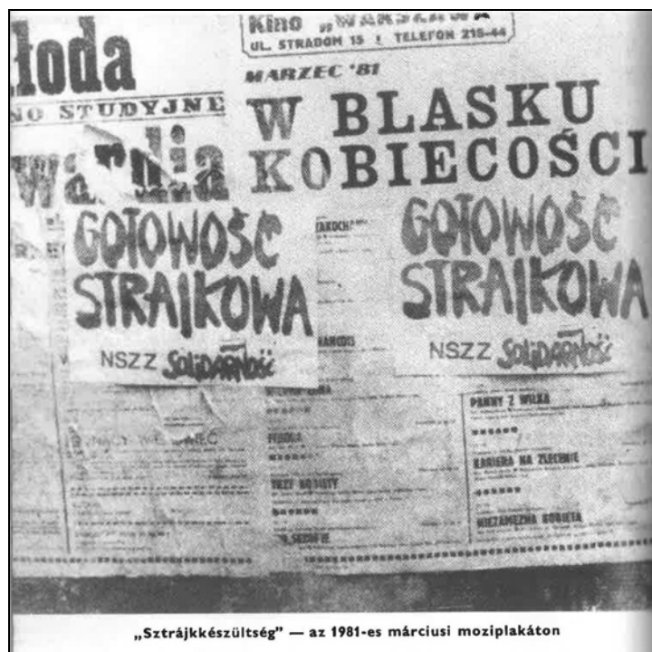
„Sztrajkkészültség” — az 1981-es márciusi moziplakáton