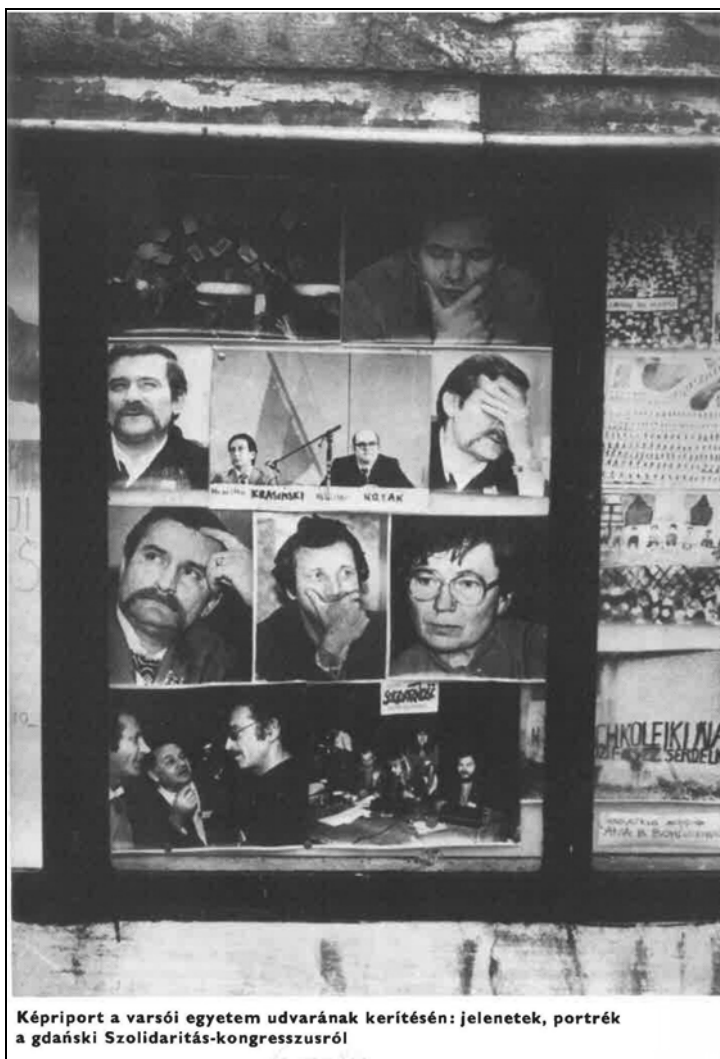
Képriport a varsói egyetem udvarának kerítésén: jelenetek, portrék a gdański Szolidaritás-kongresszusról