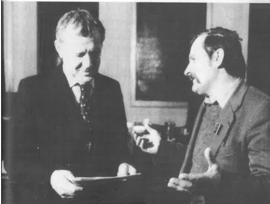
Wałęsa és Rakowski aláírásával 1981. március 30-án megállapodás jött létre a Szolidaritás és a lengyel kormány között