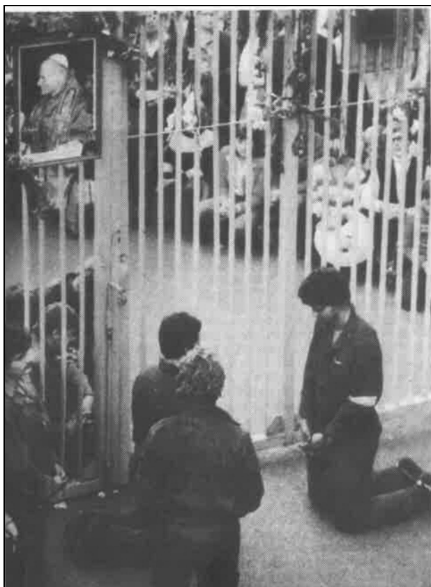
Tábori mise a gyárkapunál 1980 nyarán