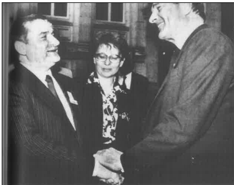
Wałęsa meghívást kapott az Emberi Jogok Egyetemes Nyilatkozata aláírásának 40. évfordulóján, 1988. december 10-én rendezett ünnepségre, Párizsba. A képen Jacques Chirac, Párizs polgármestere köszönti Wałęsát