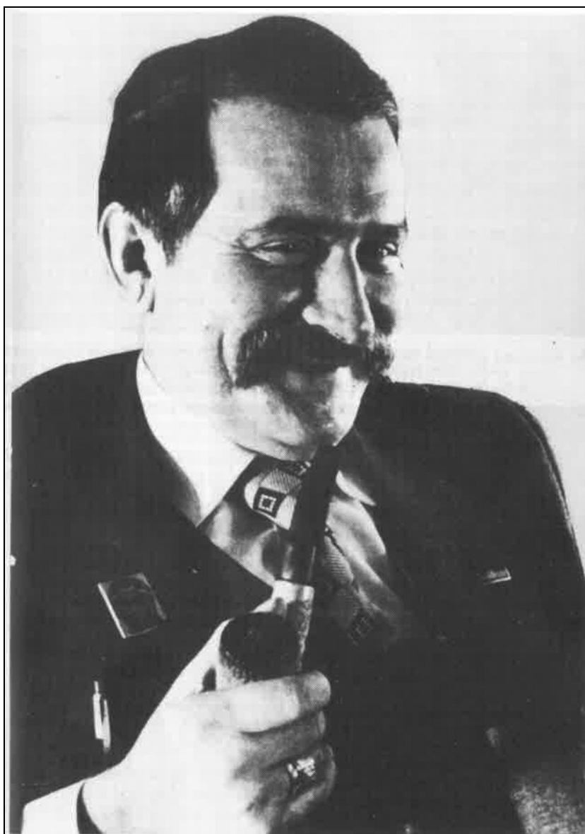
Lech Wałęsa 1981-ben