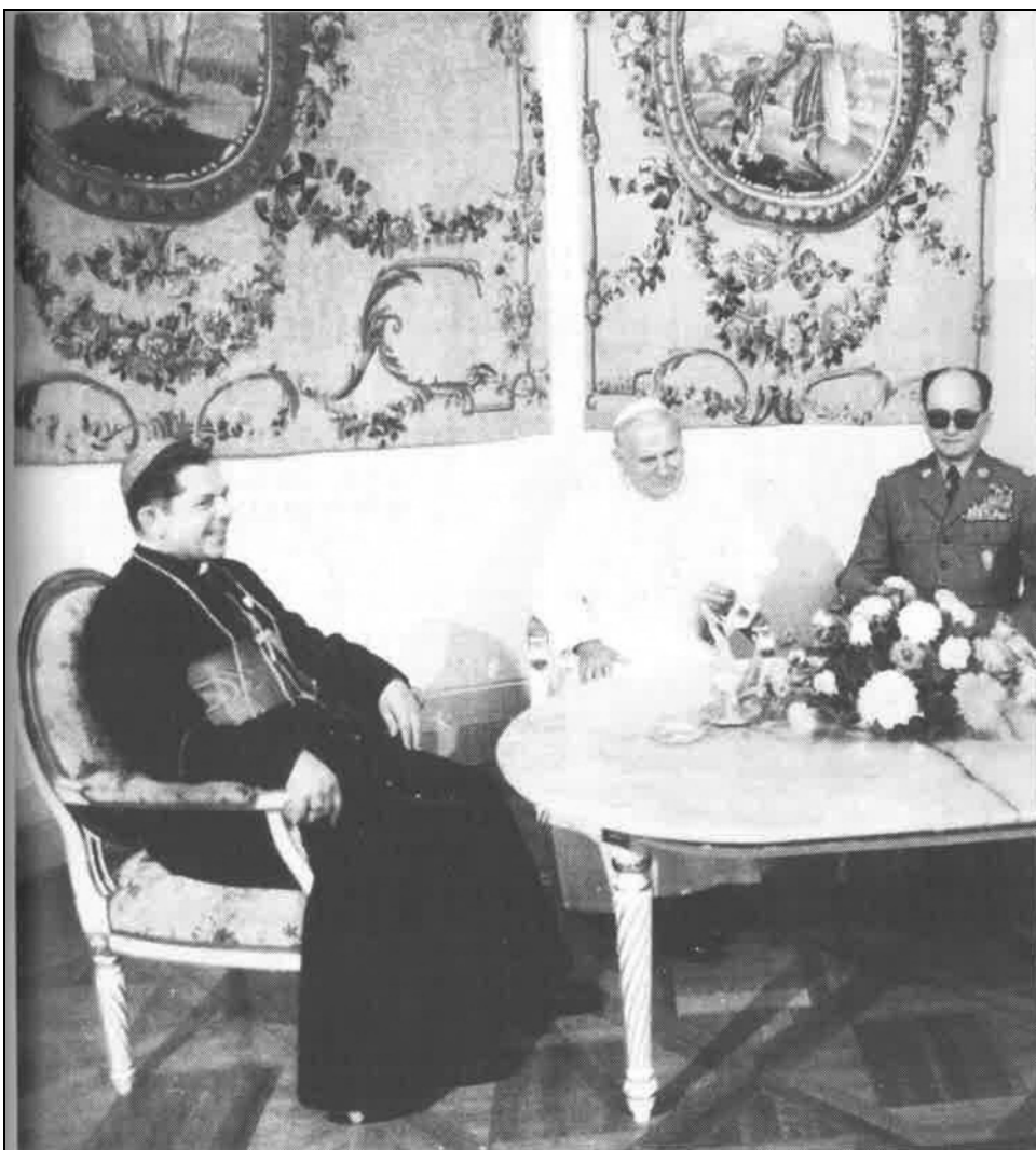
1983. június 16. Varsó, a második pápai zárándoklat. A képen Józef Glemp bíboros, lengyelországi katolikus egyházfő, II. János Pál pápa, Wojciech Jaruzelski hadsereg tábornok, kormányfő, a LEMP KB első titkára