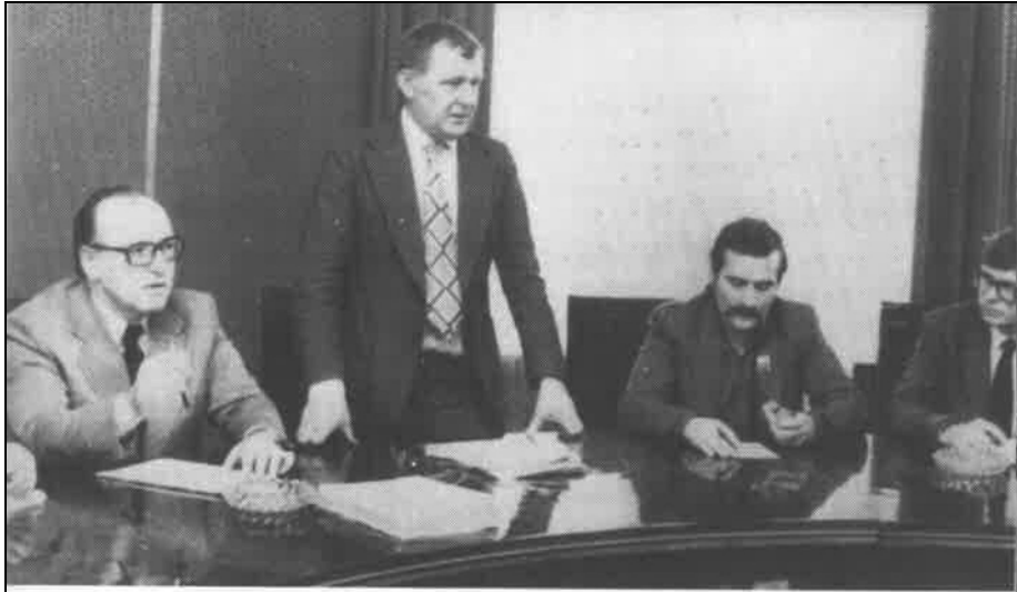
Megbeszélés a kormány és a Szolidaritás vezetősége között 1981 márciusában. A képen Ciosek szakszervezetügyi miniszter, Rakowski miniszterelnök-helyettes, Wałęsa, a Szolidaritás elnöke, és Celiński vezetőségi tag látható