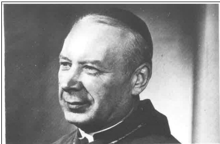
Az évszázad prímása Stefan Wyszyński bíboros (1901—1981)