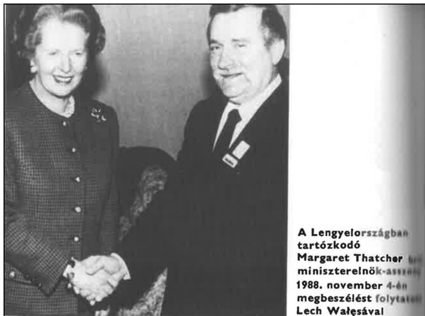
A Lengyelországban tartózkodó Margaret Thatcher miniszterelnök-asszony 1988. november 4-én megbeszélést folytatott Lech Wałęsával