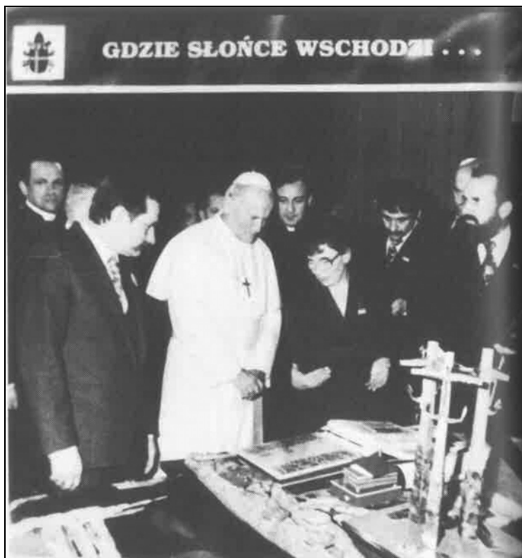
A Bécsben kiadott nagylemez (képünkön a lemezborító) őrizi II. János Pál és Lech Wałęsa 1981. január 15-én a Vatikánban elhangzott üdvözlőbeszédeit