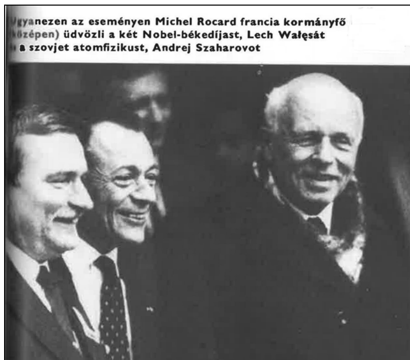
Ugyanezen az eseményen Michel Rocard francia kormányfő (középen) üdvözlí a két Nobel-békedíjast, Lech Wałęsát és a szovjet atomfizikust, Andrej Szaharovot