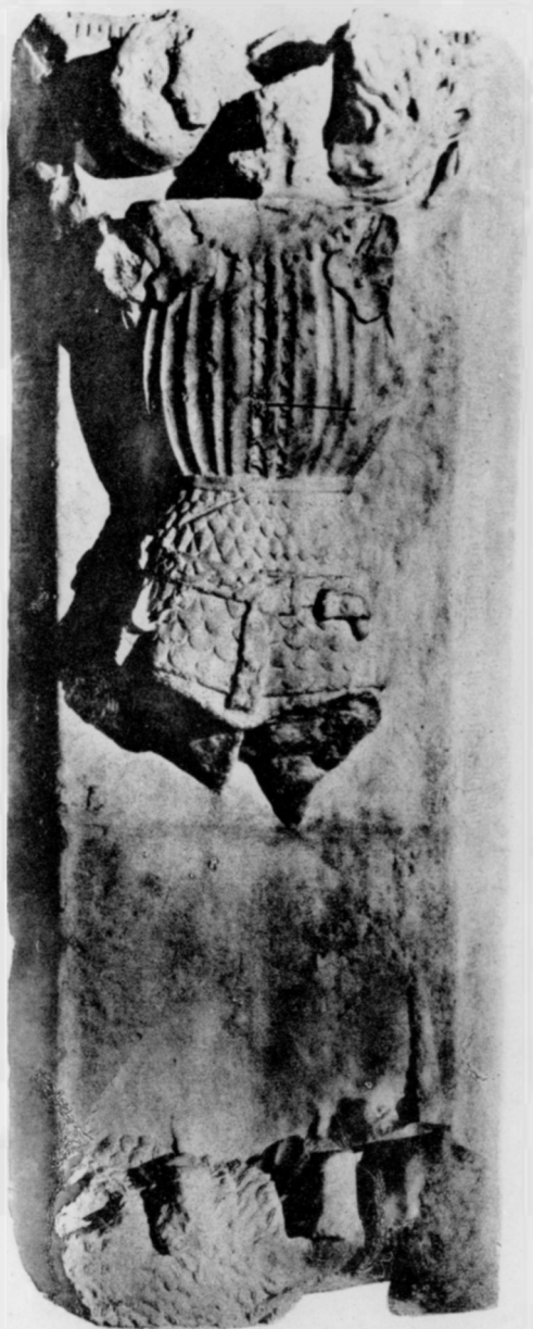
Hollenczer és Okos eredetije után Ifj. Hunyadi János „miles“ a kormányzó testvérének siremléke.