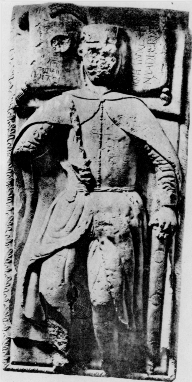
Hollenczer és Okos eredetije után Hunyadi János, a kormányzó siremléke.