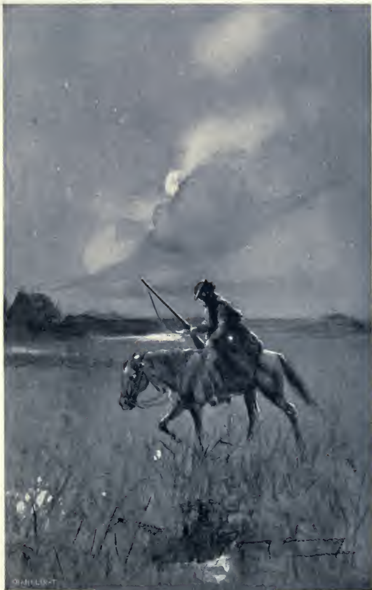
Egy lovas halad a holdvilágnál egyes-egyedül.