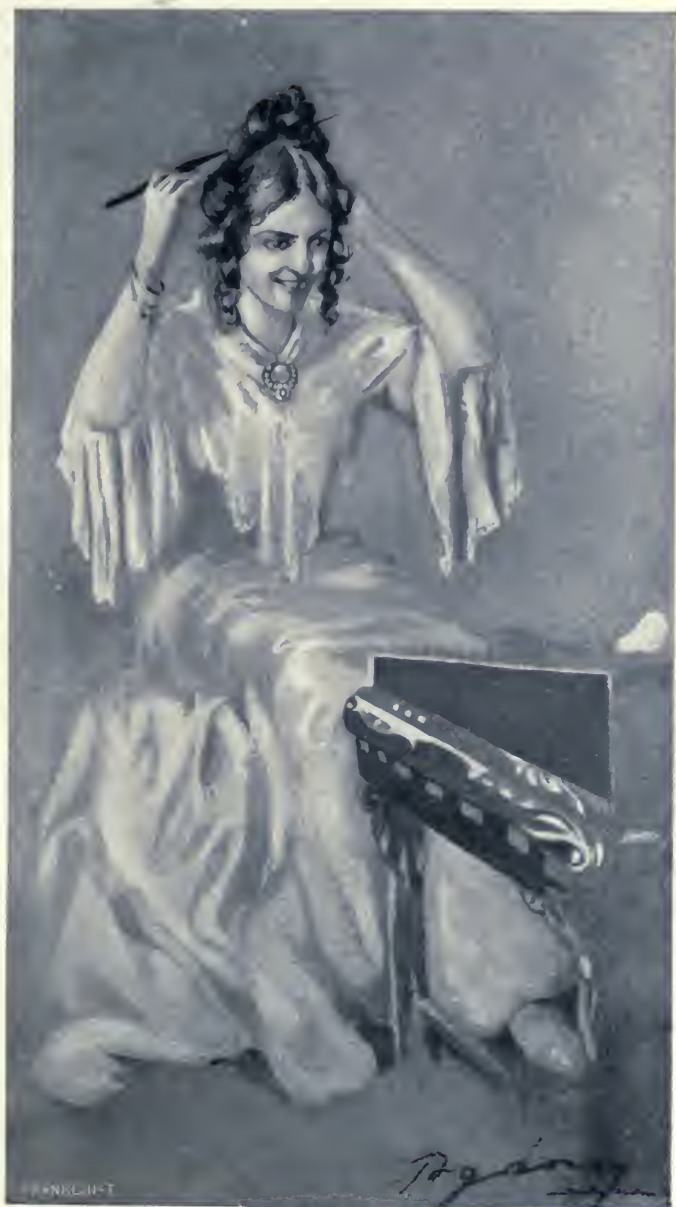
A guzsalyából kirántott orsóval keresztül tüzte.