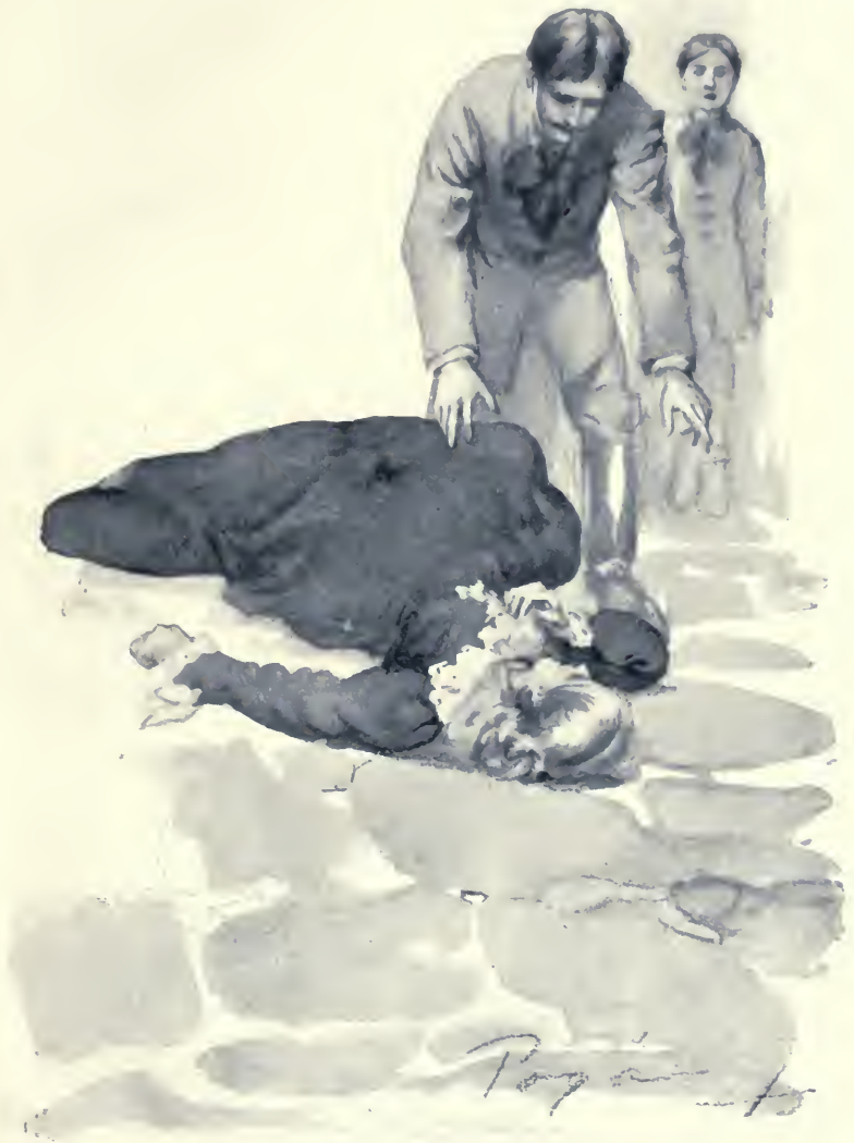
Eszméletlenül rogyott össze.