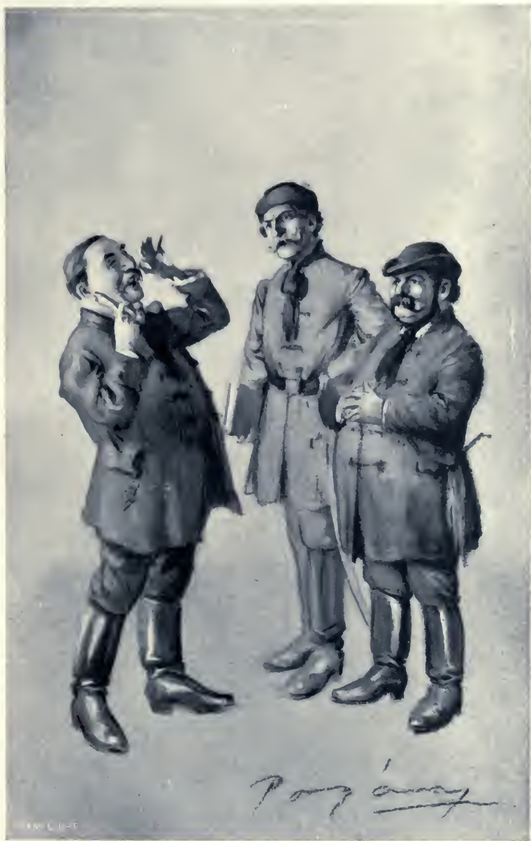
Megvasallatnak? Hababa! — kaçzagott fel Topándy.