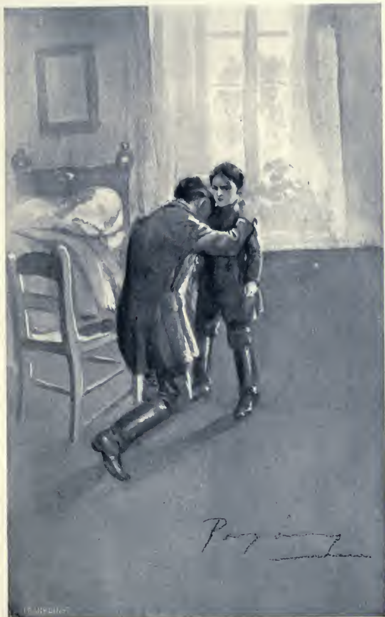
Meghalt az atyánk!